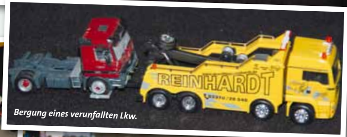
Bergung eines verunfallten Lkw.