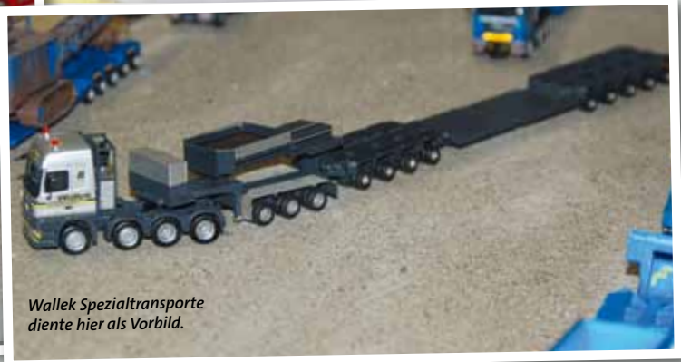
Wallek Spezialtransporte diente hier als Vorbild.