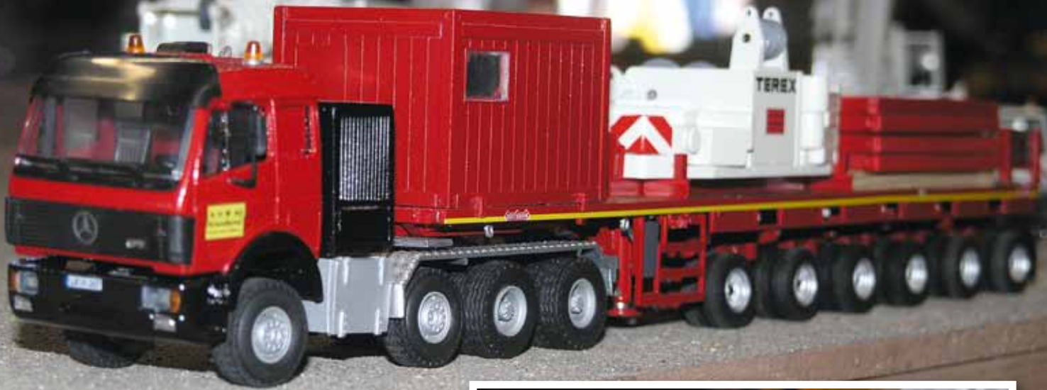
Hier wird Zubehör für einen Terex-Kran transportiert. ▶▶