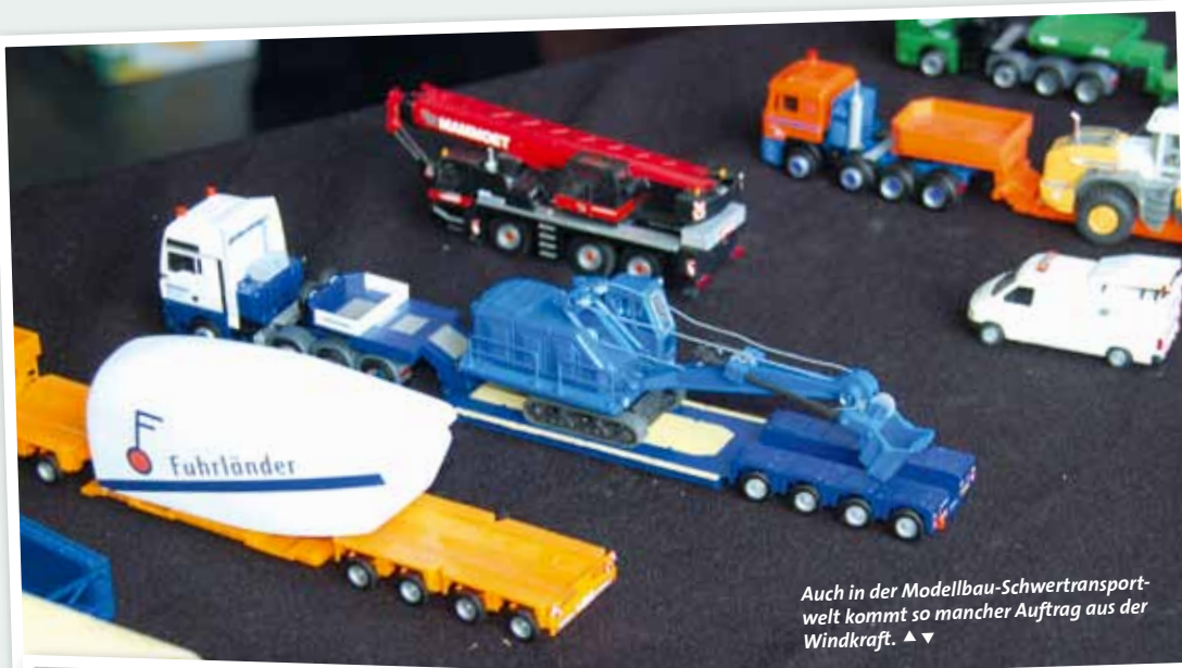
Auch in der Modellbau-Schwertransportwelt kommt so mancher Auftrag aus der Windkraft. ▲ ▼