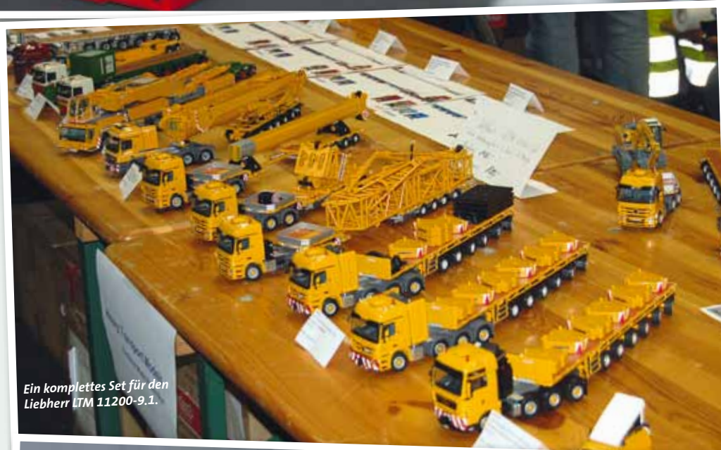
Ein komplettes Set für den Liebherr LTM 11200-9.1.