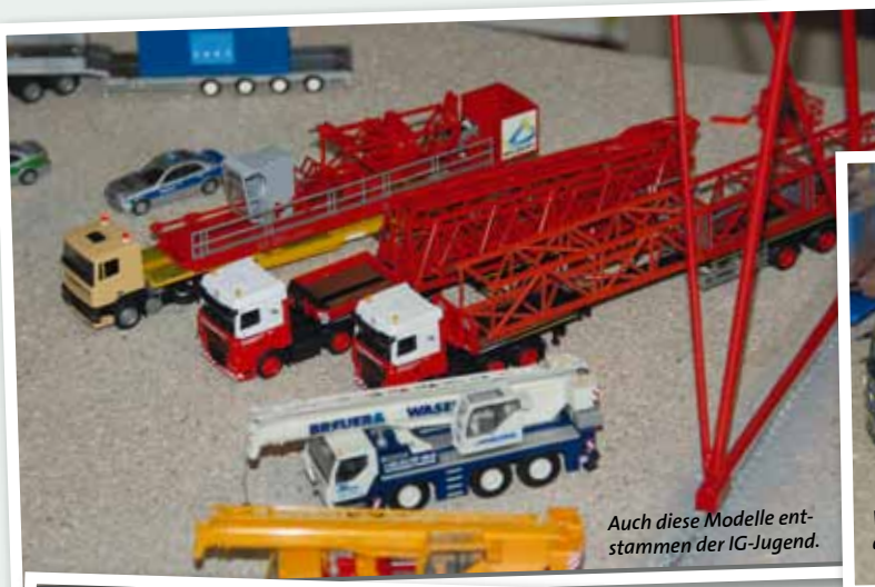
Auch diese Modelle entstammen der IG-Jugend.