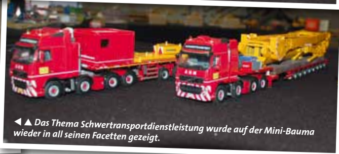
Das Thema Schwertransportdienstleistung wurde auf der Mini-Bauma wieder in all seinen Facetten gezeigt.