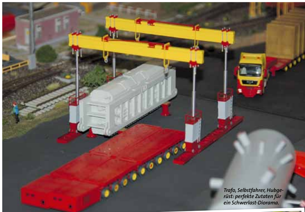
Trafo, Selbstfahrer, Hubgerüst: perfekte Zutaten für ein Schwerlast-Diorama.