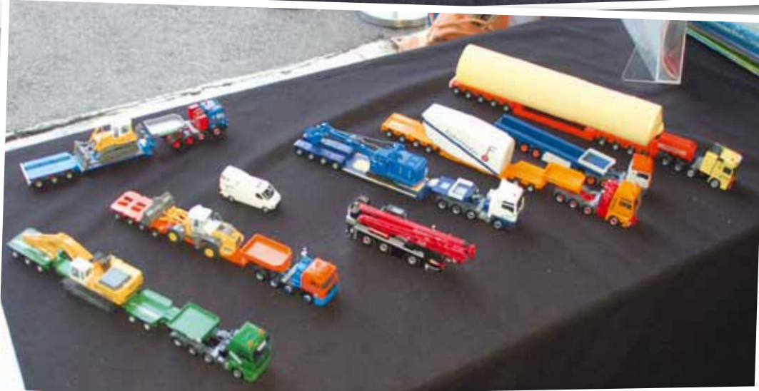
Ein eher in Übersee zu findender Grove GMK 7450 in einer Version mit 8 Achsen und Dolly konnte auf der Mini-Bauma bestaunt werden.