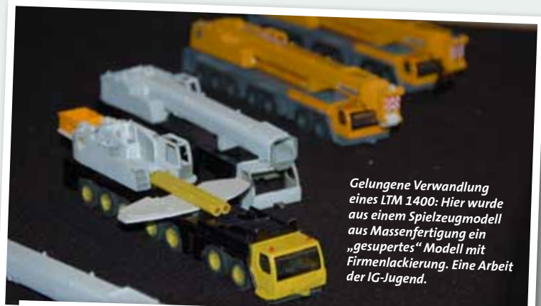
Gelungene Verwandlung eines LTM 1400: Hier wurde aus einem Spielzeugmodell aus Massenfertigung ein „gesupertes“ Modell mit Firmenlackierung. Eine Arbeit der IG-Jugend.

Mit viel Mühe hatten die Mitglieder der IG F.B.S.K e.V. Platz für so allerlei eigene Modelle sowie die der eingeladenen Modellbauer geschaffen. Auch aus Österreich und Frankreich waren in diesem Jahr Modellbauer angereist, um ihr Können einem breiteren Publikum vorzustellen.