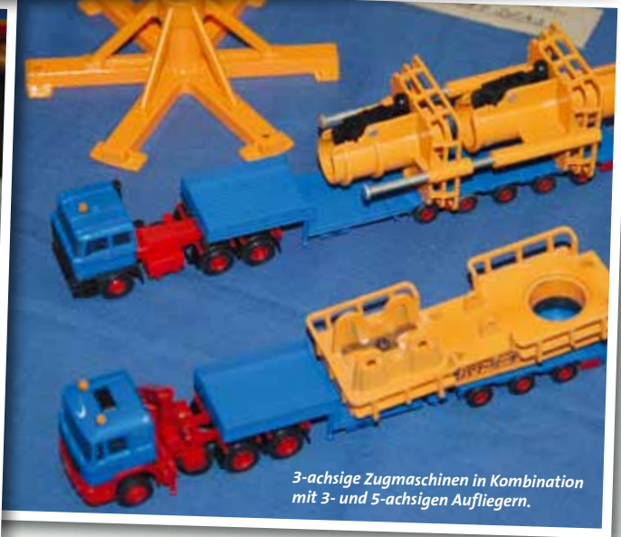
3-achsige Zugmaschinen in Kombination mit 3- und 5-achsigen Aufliegern.