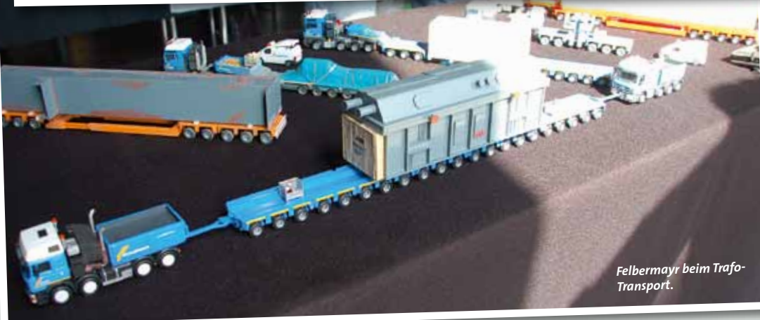
Felbermayr beim Trafo-Transport.

Im Eingangsbereich konnten im Diorama ein neu auf dem Markt erschienenes Modell des bekannten Liebherr LTM 11200-9.1 in Bracht-Lackierung und ein eher in Übersee zu findender Grove GMK 7450 in einer Version mit 8 Achsen und Dolly bestaunt werden.