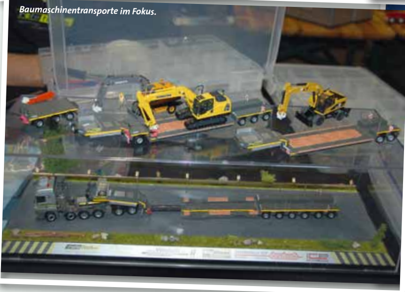
Baumaschinentransporte im Fokus.