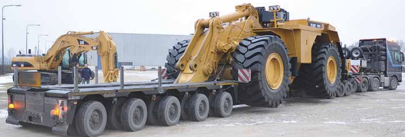
Nootboom PXE Tieflader plus 3-Achs ICP Interdolly.

Nootboom Trailers sieht eine Erholung des Marktes für den straßengebundenen Spezialtransport. Seit Beginn des vierten Quartals 2010 wächst das Auftragsvolumen beständig. Das Unternehmen will deshalb die Produktion ausweiten und die Zahl der Arbeitnehmer erhöhen.