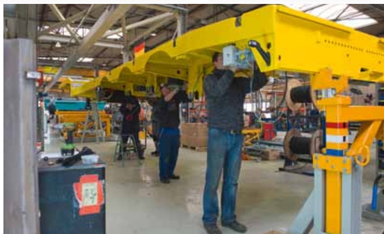
Nootboom will die Produktionskapazität erhöhen und die Mannschaft um gut 20 Neubaumonteure und Maschinenschlosser-Schweißer erweitern.