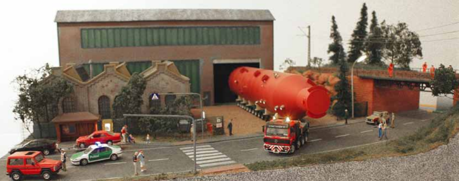
Krane und Schwertransporte in verschiedenen Facetten.