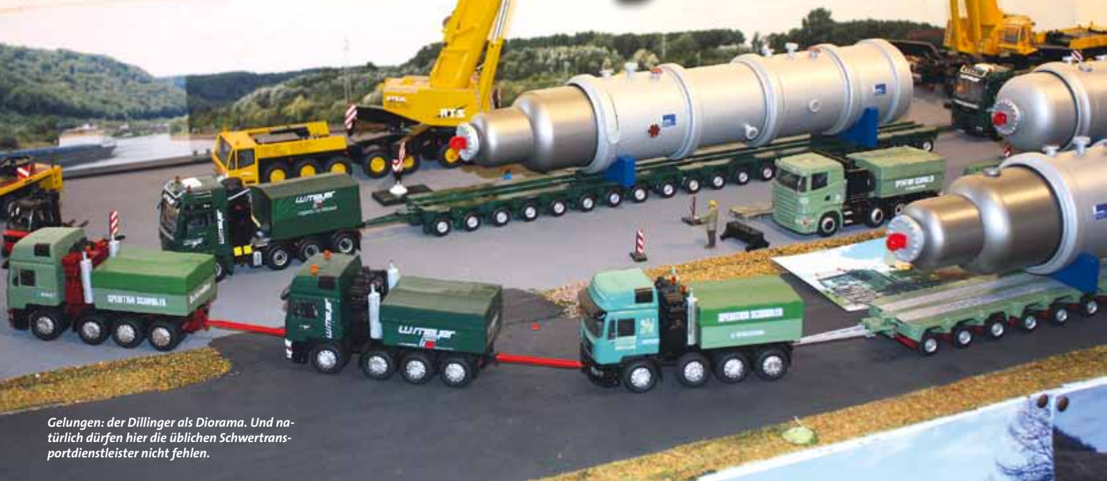
Gelungen: der Dillinger als Diorama. Und natürlich dürfen hier die üblichen Schwertransportdienstleister nicht fehlen.

Im November führte die Schwerlastgruppe Saar in der Fellenberg Mühle eine Modellbauausstellung durch. Die Veranstaltung erfreute sich nicht nur hochkarätiger Modelle, sondern auch unerwartet vieler Besucher.