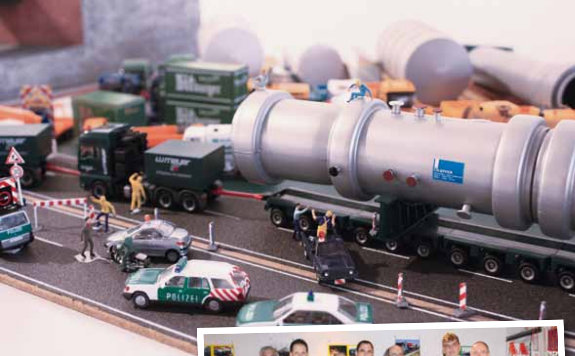
Vor etwa zwei Jahren formierte sich die Interessengemeinschaft „Schwerlastgruppe Saar“. Die jetzt durchgeführte Modellbauausstellung war ein großer Erfolg. ▼►