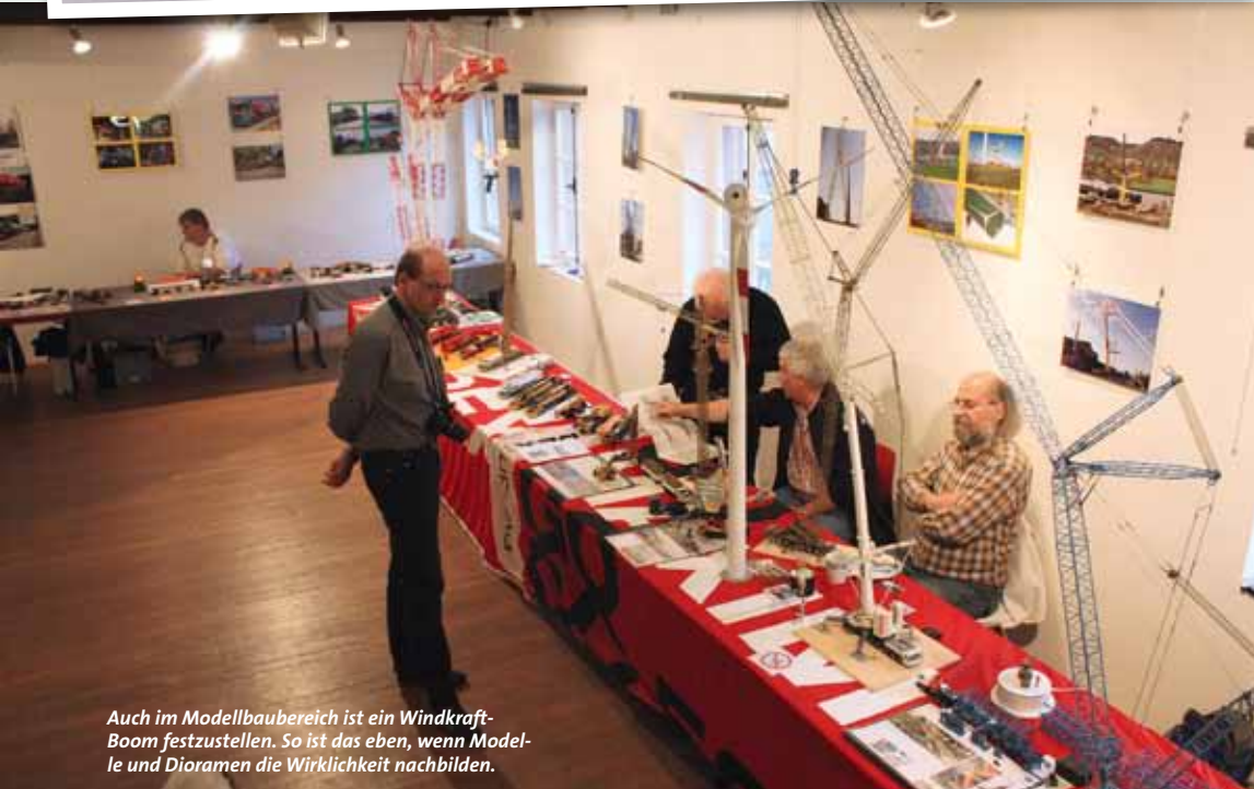
Auch im Modellbaubereich ist ein Windkraft-Boom festzustellen. So ist das eben, wenn Modelle und Dioramen die Wirklichkeit nachbilden.