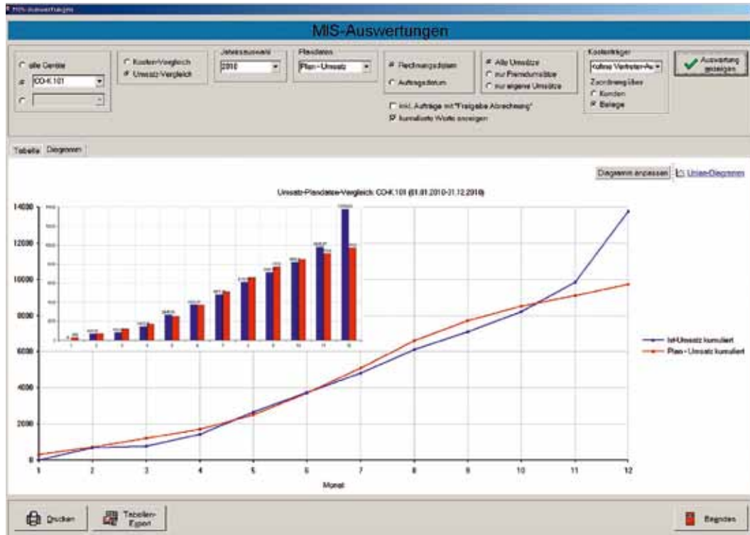
Auswertungen des Management-Information-Systems (MIS).

Im Rahmen der BSK-Jahreshauptversammlung informiert die Firma Matusch GmbH am Freitag 14.10. und Samstag 15.10.2011 im Hilton Hotel in Mainz über interessante Neuerungen der Branchensoftware E.P.O.S.