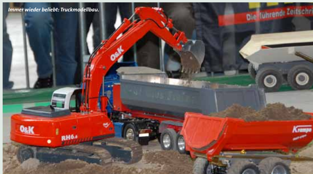
Immer wieder beliebt: Truckmodellbau.