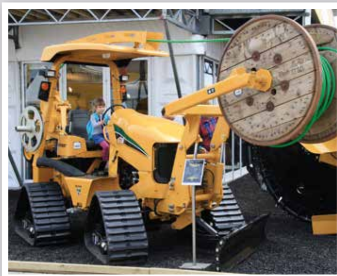
in der Kategorie Stimmung.