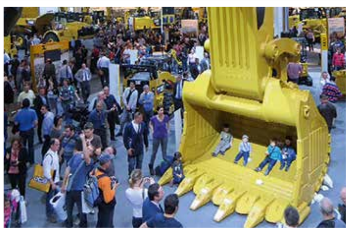
in der Kategorie Stimmung.