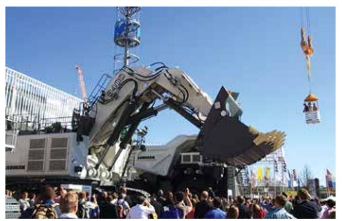
in der Kategorie Technik.