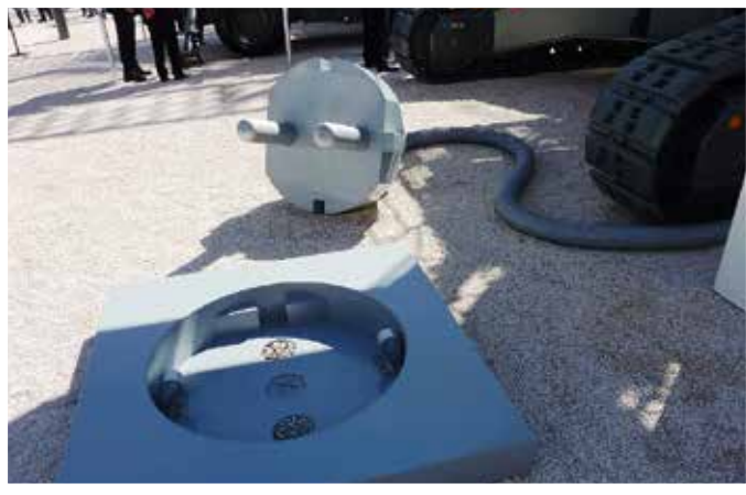
in der Kategorie Technik.