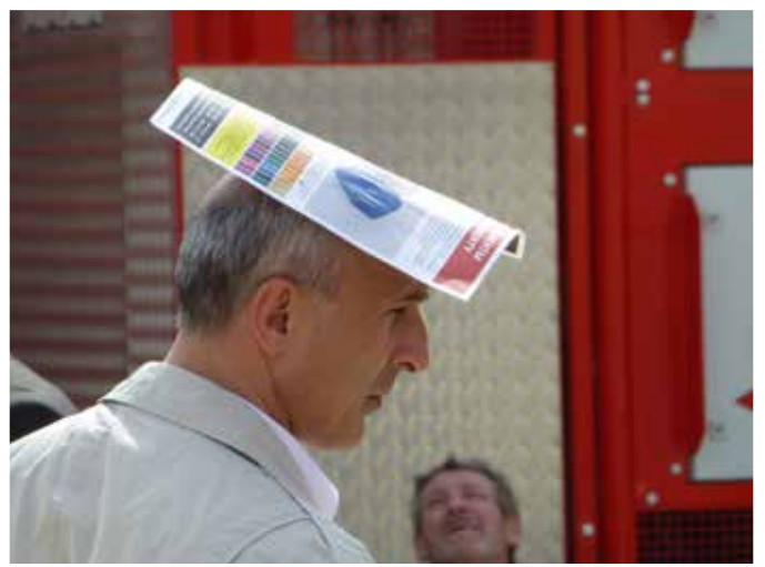
in der Kategorie Stimmung.