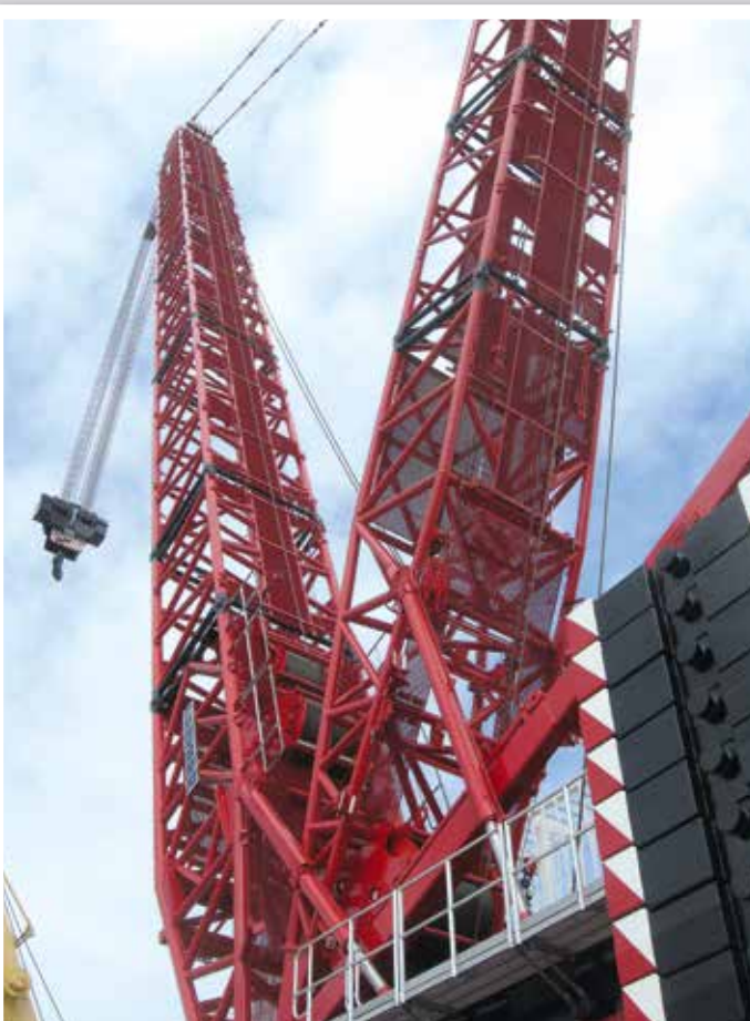
in der Kategorie Technik.