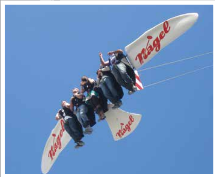
in der Kategorie Stimmung.