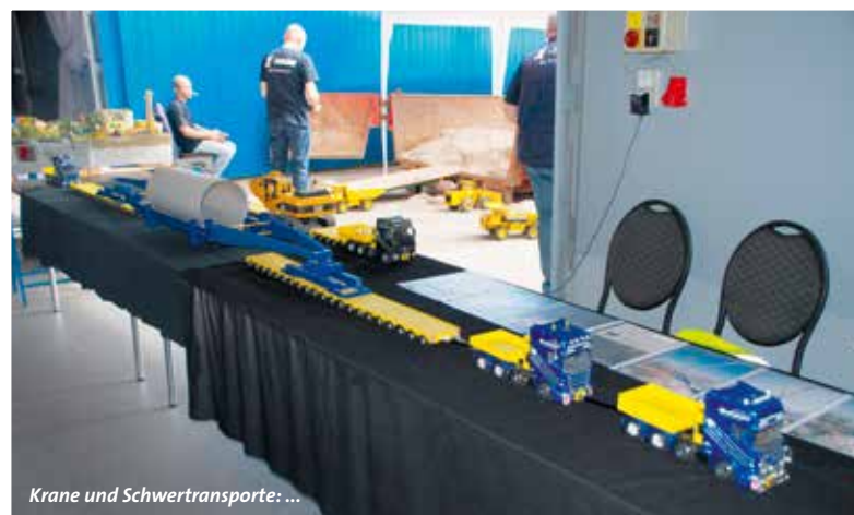
Krane und Schwertransporte: ...

Weg nach Sinsheim zu finden. Dabei kam der weiteste Aussteller aus Rumänien, weitere aus Österreich, der Schweiz und Deutschland. Wie immer war das Ausstellungsgelände umrahmt von zahlreichen Original-Exponaten. Ein 400-Tonner von Tadano Faun, ein 300-Tonner von Grove sowie ein 8-achsiger Scheuerle-Semi-Tieflader waren die diesjährigen Glanzlichter im Außenbereich. Drinnen tummelten sich an beiden Tagen etwa 1.000 Besucher, viele mit Kindern. Das