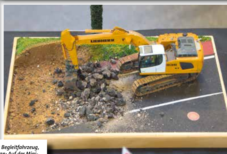
Von Tractomas bis Begleitfahrzeug, von Bagger bis Kran: Auf der Mini-Bauma gab es wieder alles, was auch auf der Bauma zu sehen ist – maßstabsgerecht.