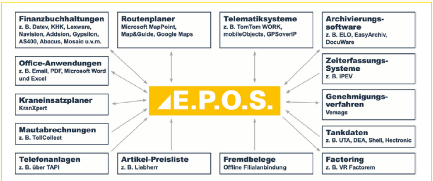
E.P.O.S. bietet verschiedene Schnittstellen an.

Ist-Vergleich. Je nach Telematiksystem können auch die Meldungen des digitalen Tachografen über die E.P.O.S. Fahrzeugkommunikations-Schnittstelle abgefragt und in E.P.O.S. eingelesen werden. Somit können auch die Lenk- und Arbeitszeiten des Fahrpersonals in Echtzeit in der Disposition angezeigt und besser geplant