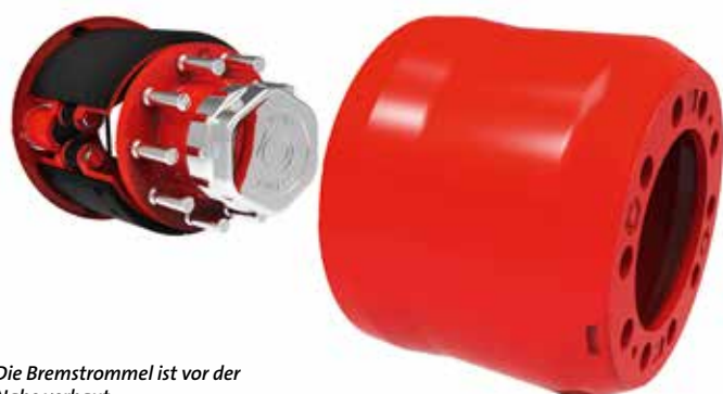
Die Bremstrommel ist vor der Nabe verbaut.

Eine wartungsarme Lenkerlagerung ist bei gigant ein zentrales Anliegen. Im Fall der DLS-Achse