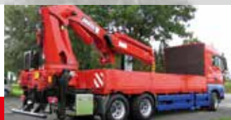
MAN 3-Achs-LKW, Typ TGX 26.440 6x4 BL, mit MKG-Ladekran HLK 591