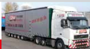
3- bis 5-Achs-Jumbo-Sattelauflieger, verbreiterbar und anhebbar