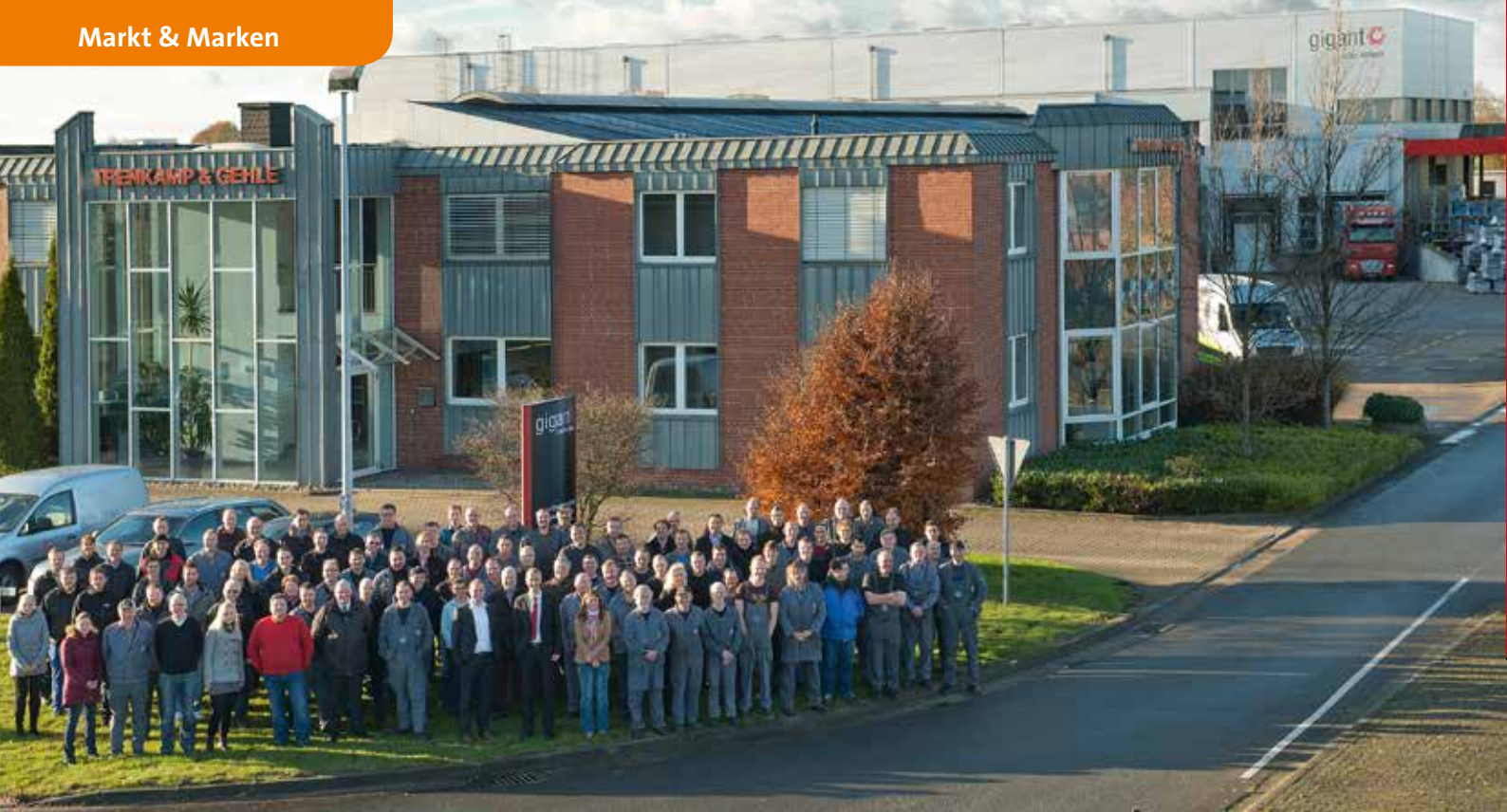
Zur Zeit sind bei gigant knapp 150 Mitarbeiter in Verwaltung und Produktion tätig.

plett wartungsfreie Kompaktlager. Dies bietet verlängerte Lebensdauer ohne Einstellarbeiten und spart Zeit, Aufwand und Geld. Bei Einsatz innerhalb Europas gibt gigant auf das Radlager eine Garantie von bis zu 300.000 km oder 6 Jahren.