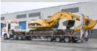
autorisierter Händler für MAX-Trailer in Deutschland

FÜR KOMPLETTES LIEFERPROGRAMM MIETE/MIETKAUF MÖGLICH