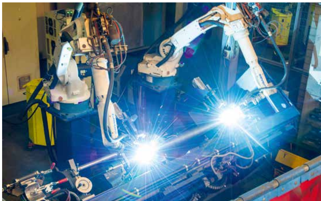
Die Produktion ist komplett an den Stammsitz nach Dinklage verlagert worden.