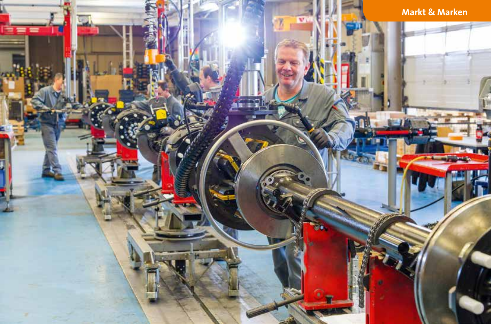
Am traditionellen und stärksten Produktprogramm von Schwerlast- und Tiefladerachsen hält gigant ebenso fest wie an dem Segment der leichten Achsen mit Achslasten ab 5,5 t.