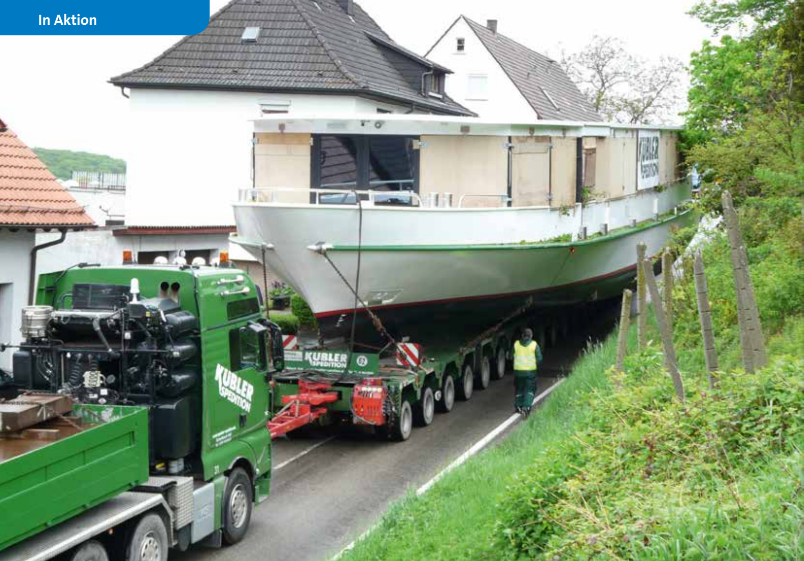
Vorne wird gezogen, hinten wird geschoben.

Heilbronn oftmals unterbrochen werden muss – die Herausforderungen des Schwertransporttags.