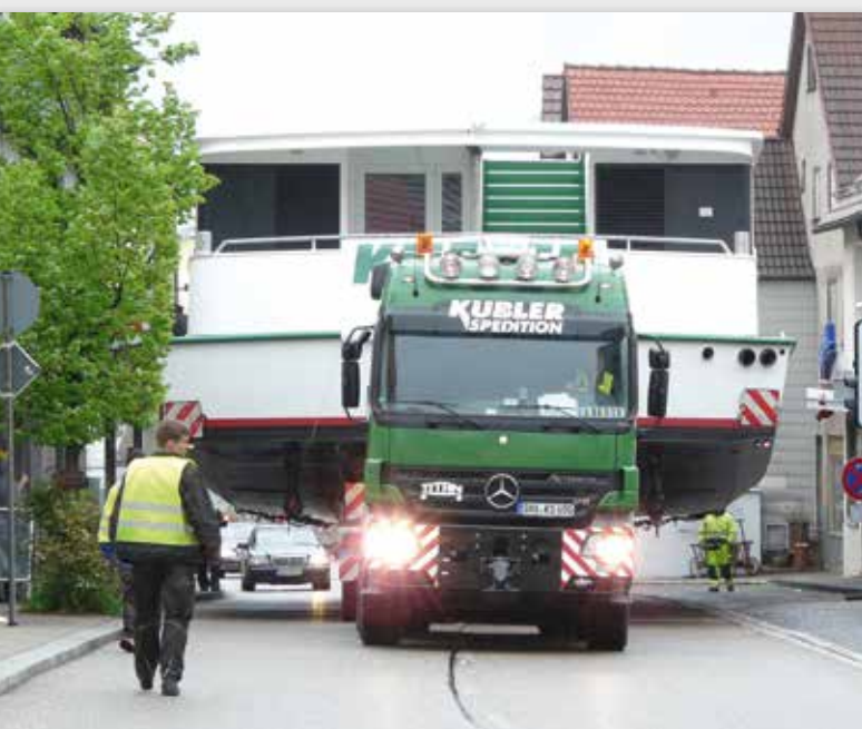
7,8 m breit war das Schiff, das Kübler transportierte.