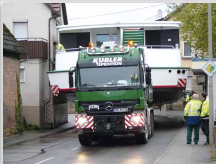
Auch an dieser Stelle ist genaues Hingucken und Fingerspitzengefühl gefragt.