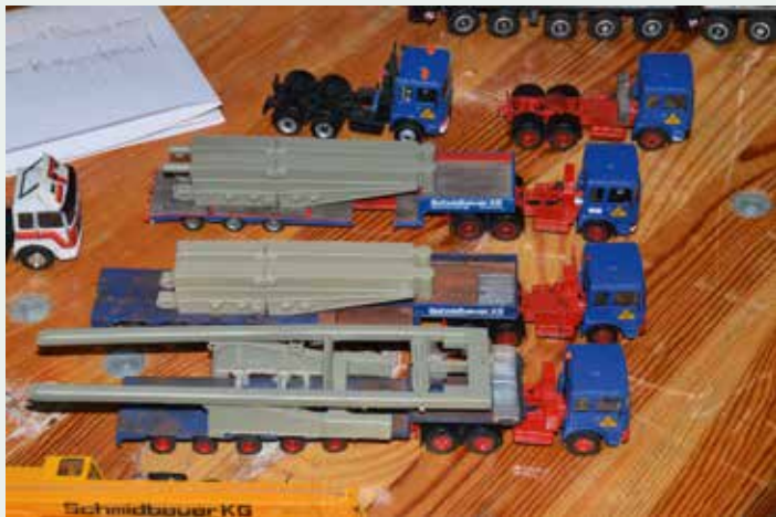
Schmidbauer-Fahrzeuge, beladen mit Krankomponenten.