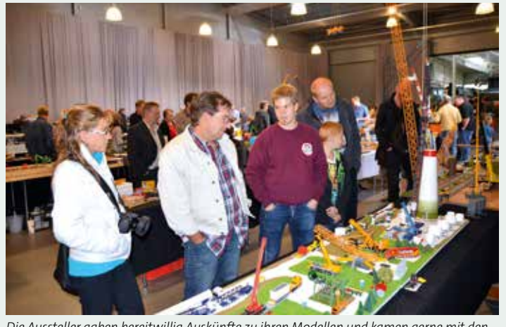
Die Aussteller gaben bereitwillig Auskünfte zu ihren Modellen und kamen gerne mit den Besuchern ins Gespräch.