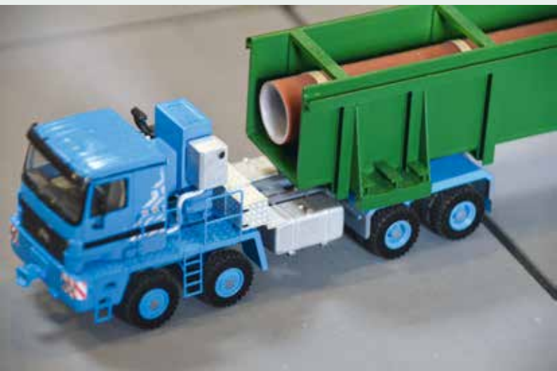
Viele der auf der Mini Bauma ausgestellten Modelle überzeugten wieder durch viel Liebe zum Detail.