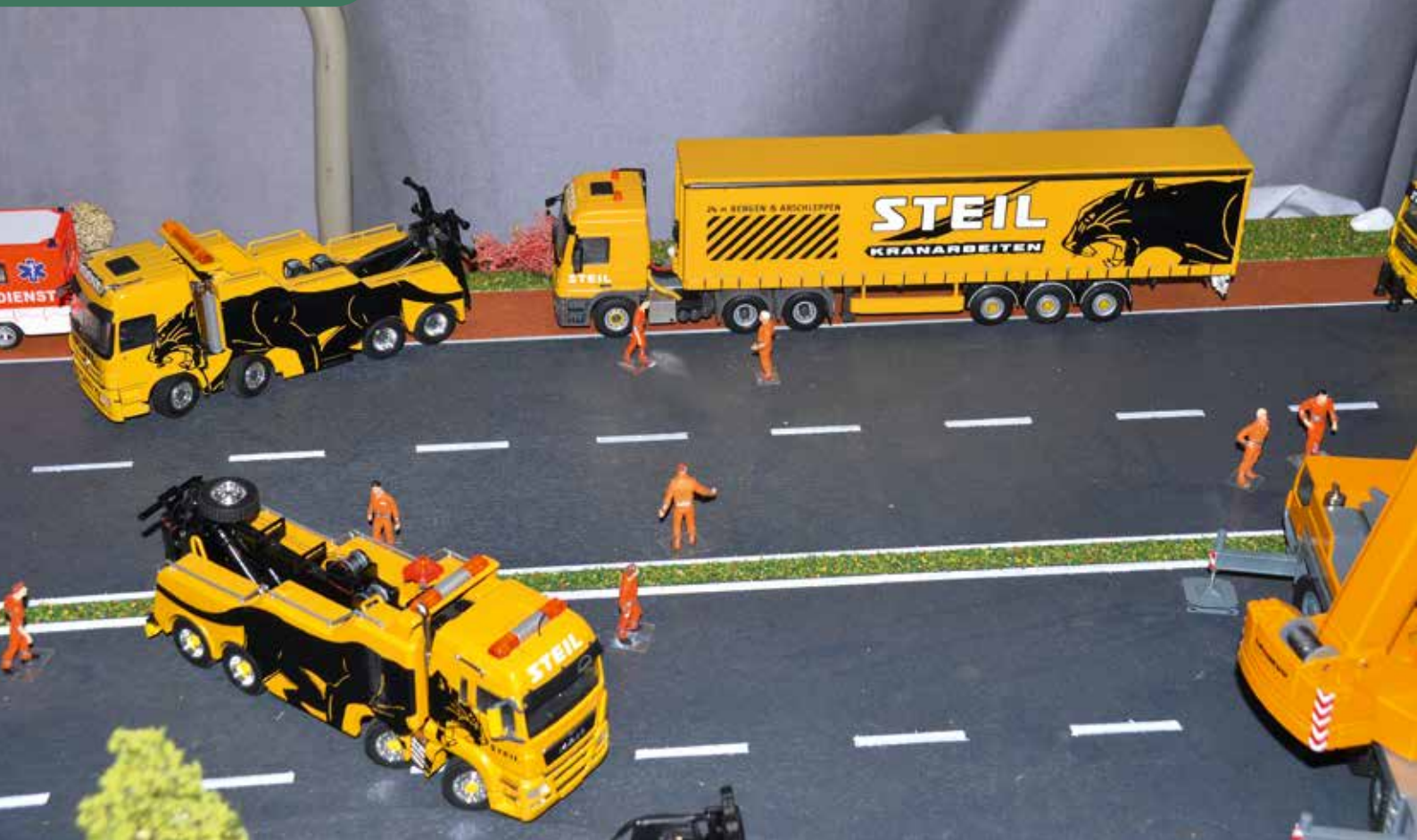
Fahrzeuge von Steil Kranarbeiten gab es in diesem Jahr nicht nur in Modellform zu bewundern, sondern auch in echt.