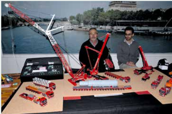
Riga Mainz, wohin das Auge blickt..