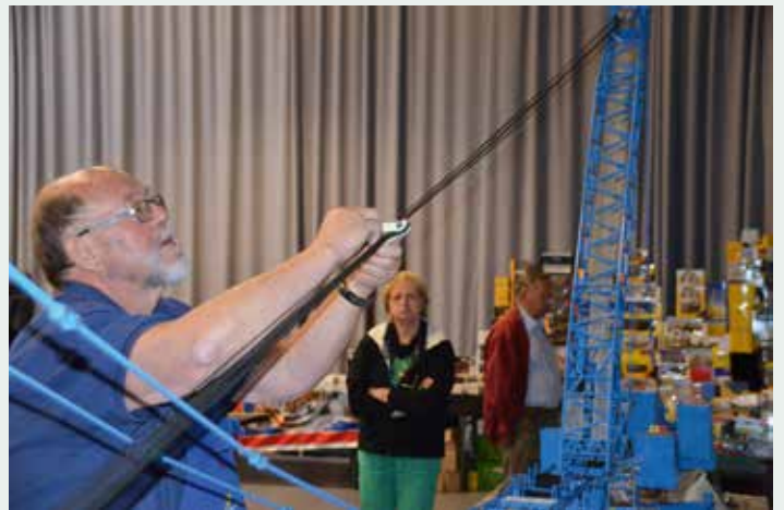
Wie im echten Leben: die Aufbauarbeiten nehmen viel Zeit in Anspruch.