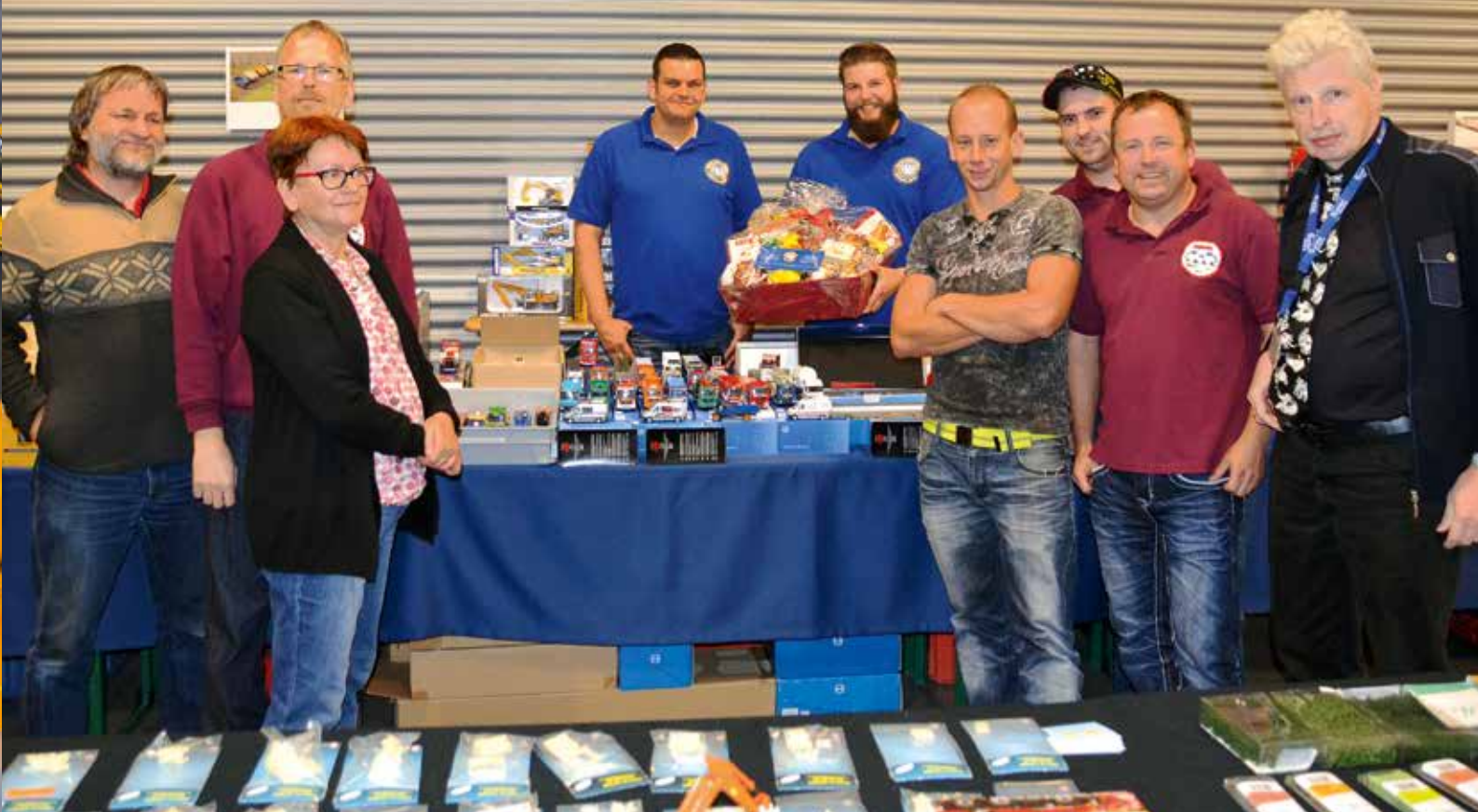
Herzlichen Glückwunsch zum 20sten wünscht Fritzes Modellbörse.