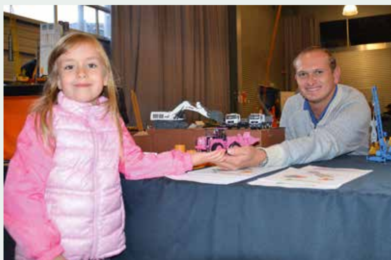
So sehen Mädchenträume von heute aus: „Hello Kitty“-Radlader.