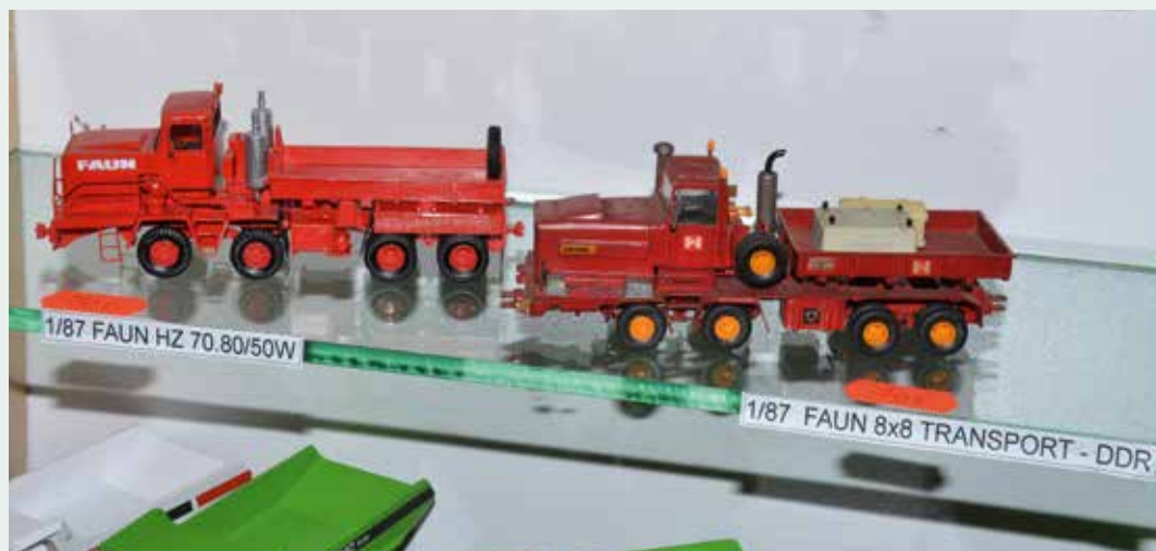
Zwei Generationen Faun im Maßstab 1:87.

Auch die Freunde der Sandkiste kamen in diesem Jahr wieder auf ihre Kosten. Überraschung: Fritzes Modellbörse gratulierte mit einer kleinen