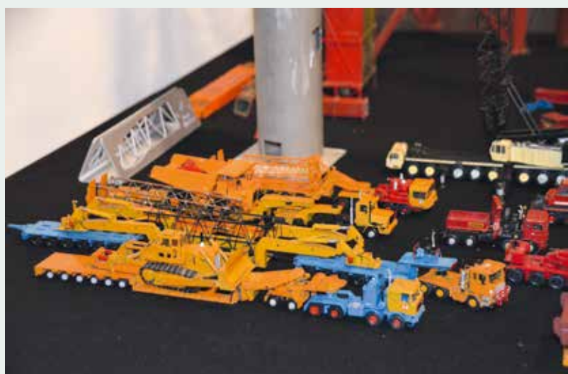
Ein kleines Highlight waren die komplett in Eigenbau aus Messing gefertigten Modelle eines Modellbaufreundes aus der ehemaligen DDR, die in den 70iger und 80iger Jahren entstanden sind. Nachdem der Modellbaufreund seine Modelle in gute Hände abgegeben hatte, verstand es sich von selbst, sie auf der Mini Bauma der Öffentlichkeit zu präsentieren.