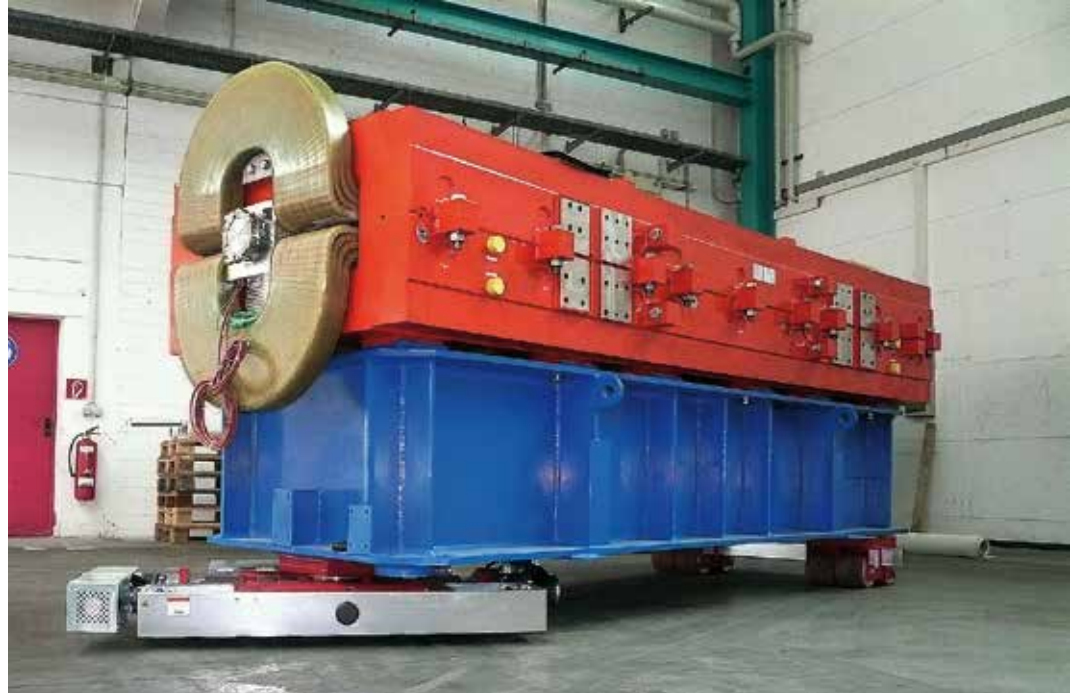
ROBOT nennt seinen neuen Selbstfahrer GKS.

Dieses Modell wird auf der diesjährigen AMB in Halle 7, Stand A 37 dem interessierten