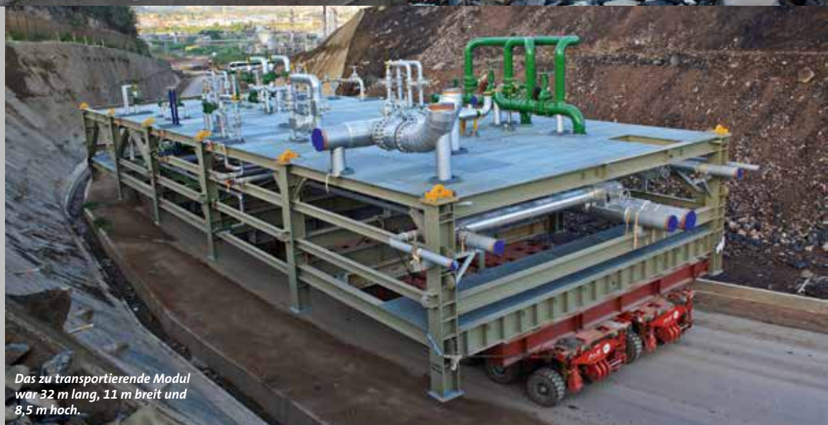
Das zu transportierende Modul war 32 m lang, 11 m breit und 8,5 m hoch.

Für den Transport des 32 m langen, 11 m breiten und 8,5 m hohen Moduls setzte ALE auf insgesamt 40 Achslinien des bewährten, selbst angetriebenen Modultransporters. Durch die