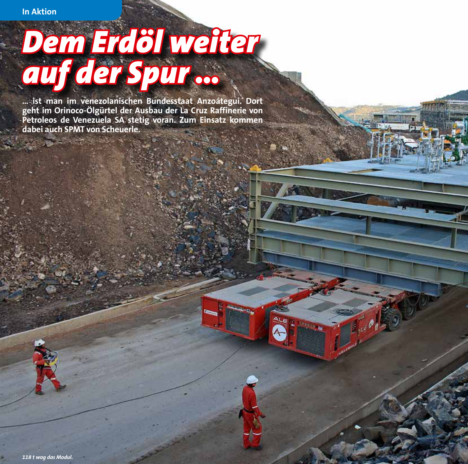
118 t wog das Modul.

... ist man im venezolanischen Bundesstaat Anzoátegui. Dort geht im Orinoco-Ölgürtel der Ausbau der La Cruz Raffinerie von Petroleos de Venezuela SA stetig voran. Zum Einsatz kommen dabei auch SPMT von Scheuerle.