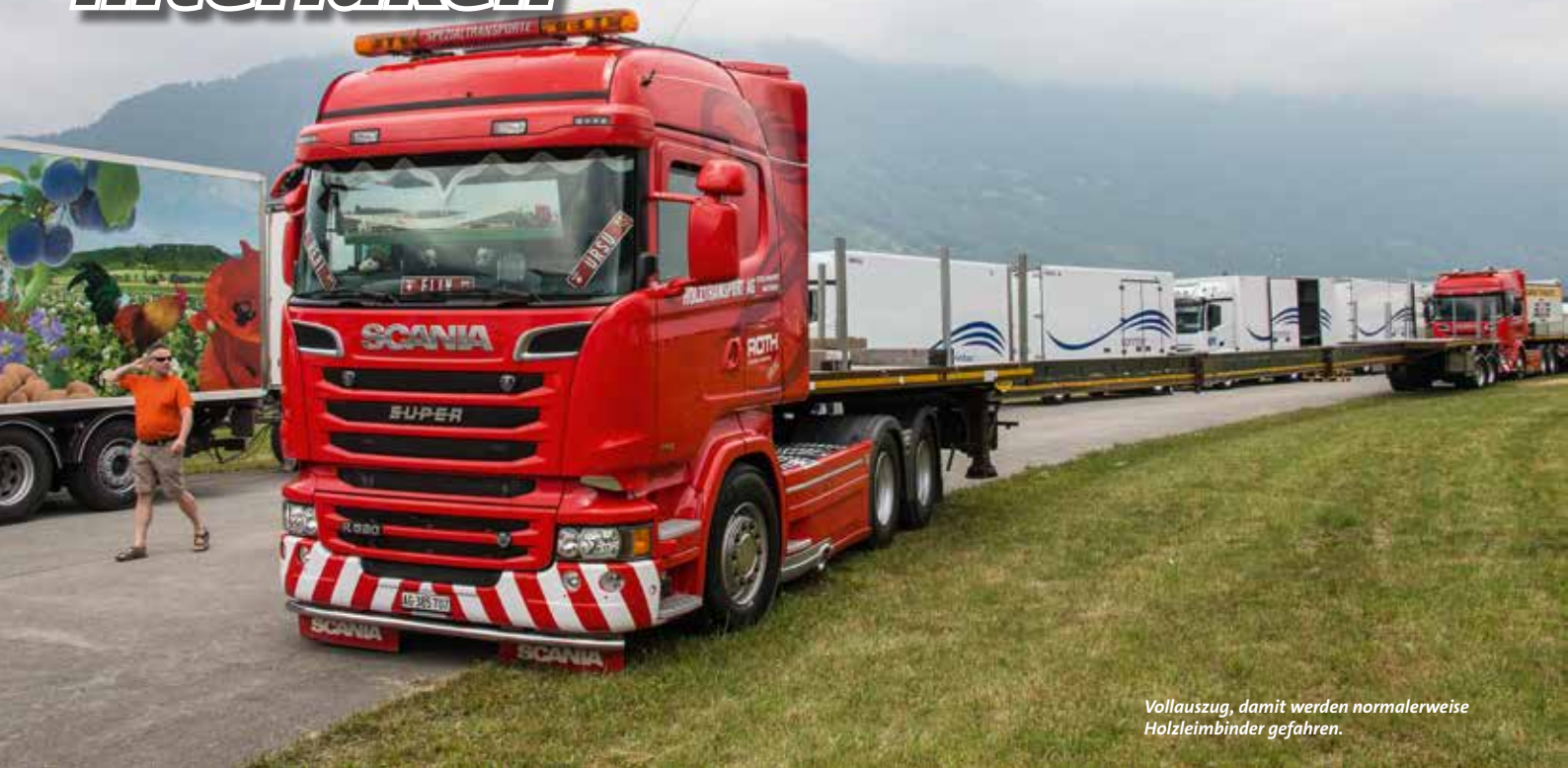
Vollauszug, damit werden normalerweise Holzleimbinder gefahren.

Jedes Jahr am letzten Wochenende des Monats Juni lockt Interlaken mit dem Truckerfestival 1.400 Trucks und deren Freunde ins beschauliche Berner Oberland. Darunter sind jedes Jahr auch „schwere Jungs“, sprich Schwer- und Ausnahmetransporter teilweise mit Ladung. Wir haben uns mal umgeschaut, wie die 24igste Ausgabe des grössten Schweizer Trucktreffens in Sachen Schwerlast drauf war. Text und Bilder: Erich Urweider