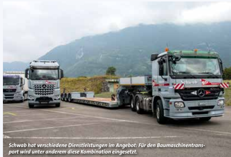
Schwab hat verschiedene Dienstleistungen im Angebot: Für den Baumaschinentransport wird unter anderem diese Kombination eingesetzt.