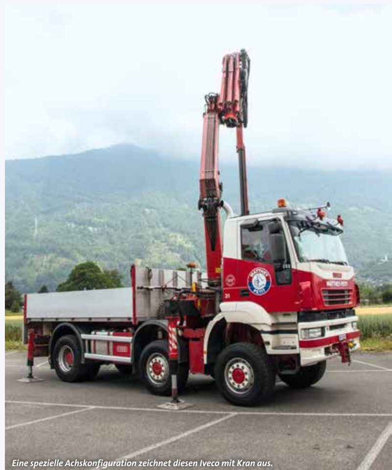
Eine spezielle Achskonfiguration zeichnet diesen Iveco mit Kran aus.