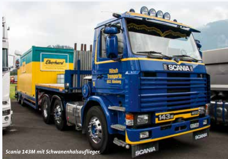
Scania 143M mit Schwanenhalsaufleger.

Nun wir waren aber auf der Suche nach Schwertransporten oder mindestens doch Schwerlastzugmaschinen. Einige haben wir dann noch gefunden, auch wenn die Westschweizer schon stärker vertreten waren. Hier spürt man teilweise den Kostendruck, denn die Schwerkverkehrsabgaben müssen auch für Festivitäten bezahlt werden. Und benötigt man gar eine Sondergenehmigung, wird ein Festivalbesuch schnell recht teuer.