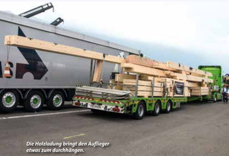
Die Holzladung bringt den Auflieger etwas zum durchhängen.