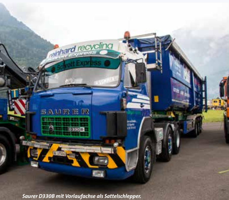
Saurer D330B mit Vorlaufachse als Sattelschlepper.

Laut Veranstalter wurden 1.400 Trucktickets ausgegeben, aber immer wieder hörte man dieses Jahr: „Hör mal, ich glaub, es sind nicht so viele Trucks da wie sonst.“ Auch am Samstag-