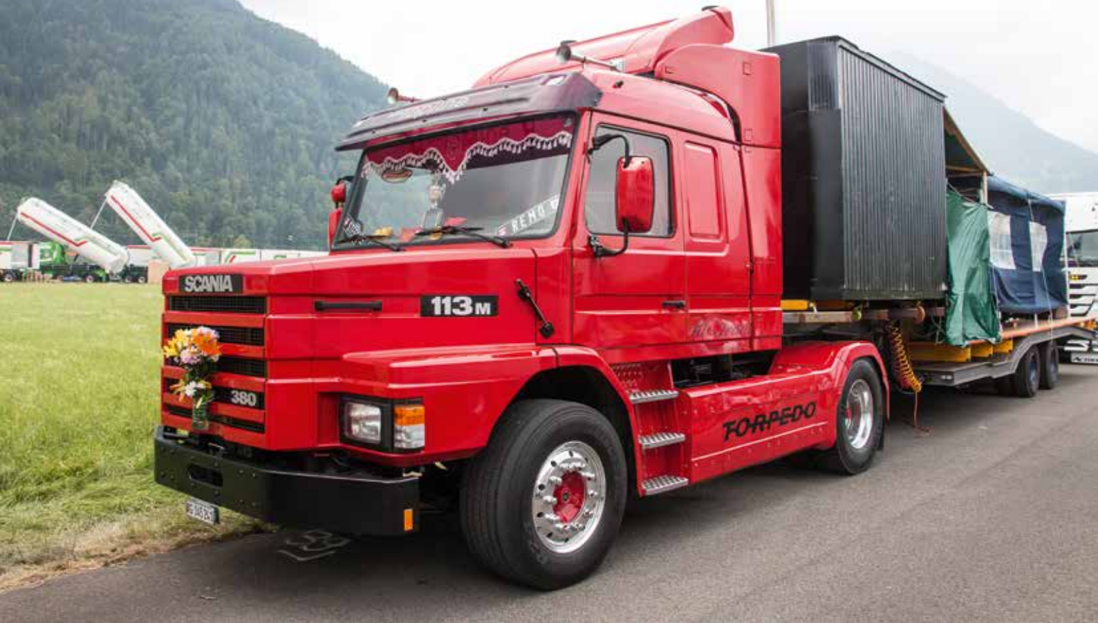
Scania Hauber mit einem Auflieger, der auch schon etwas älter sein dürfte.