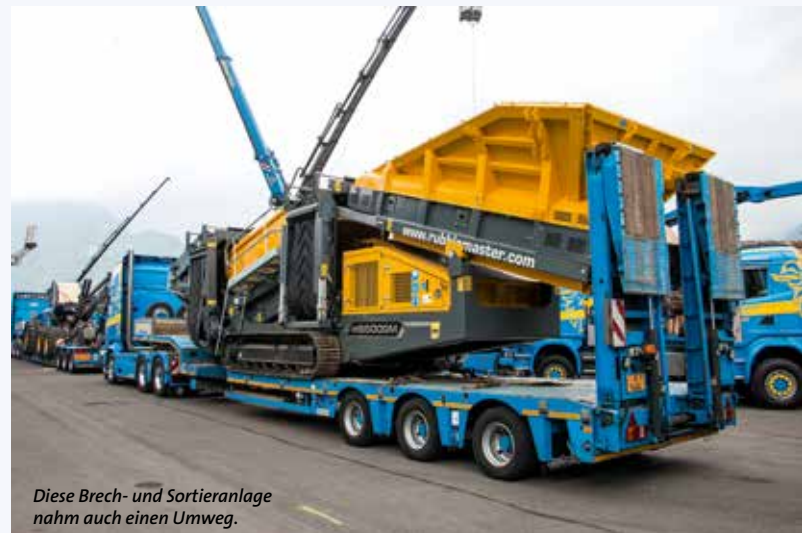
Diese Brech- und Sortieranlage nahm auch einen Umweg.