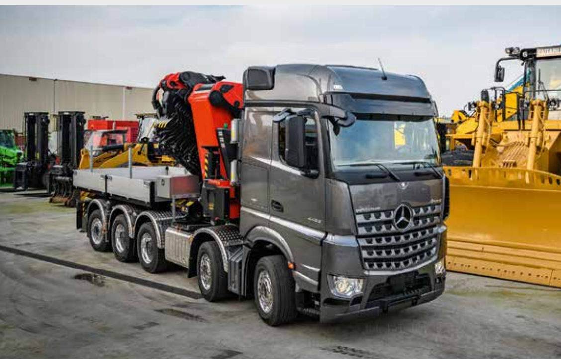
Eine starke Kombination ...