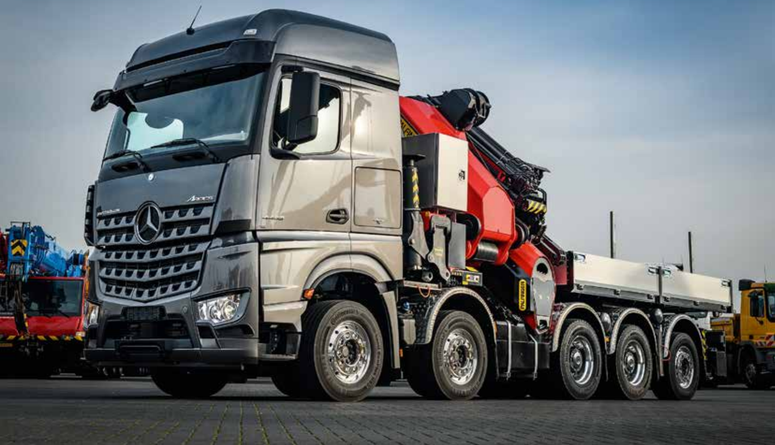
... wurde mit diesem 165 mt-Palfinger-Ladekran auf einem 5-achsigen Arocs realisiert.