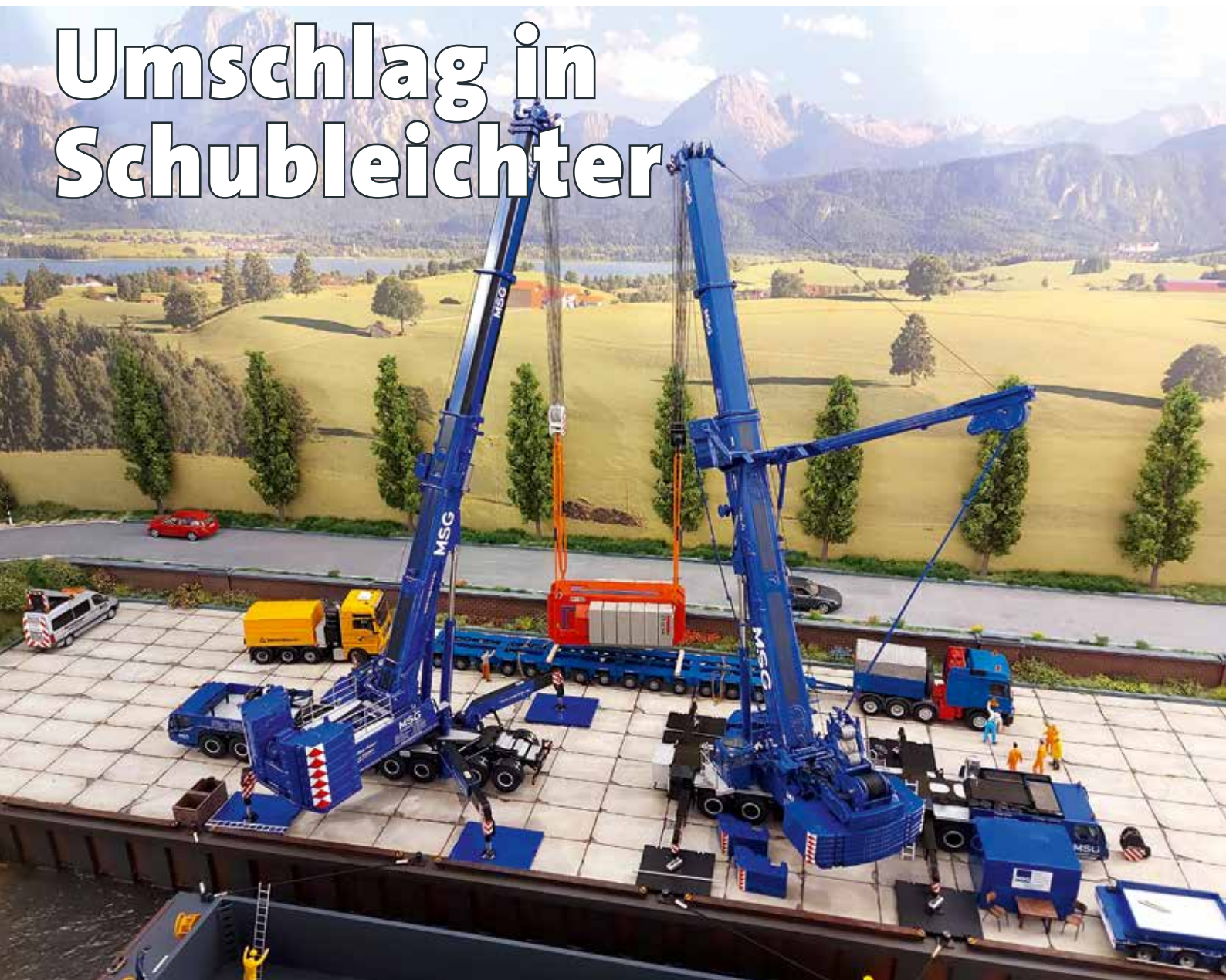
MSG bei der Verladung eines Transformators.

Modelle und Dioramen im Maßstab 1:50 sind das Metier unseres Lesers Stephan Linde. Aber auch Modelle im Maßstab 1:87 und eine Modellbahn, Spur HO, finden sich in der Sammlung des 46-Jährigen.