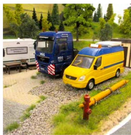
Auch ein Begleitfahrzeug darf nicht fehlen.