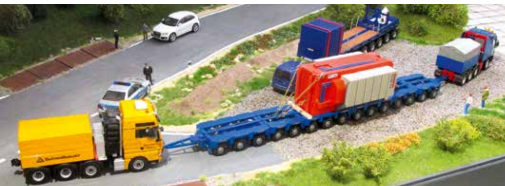
Mit vereinten Kräften: Im Zug-Schub-Verbund gehts zur Verladestelle.