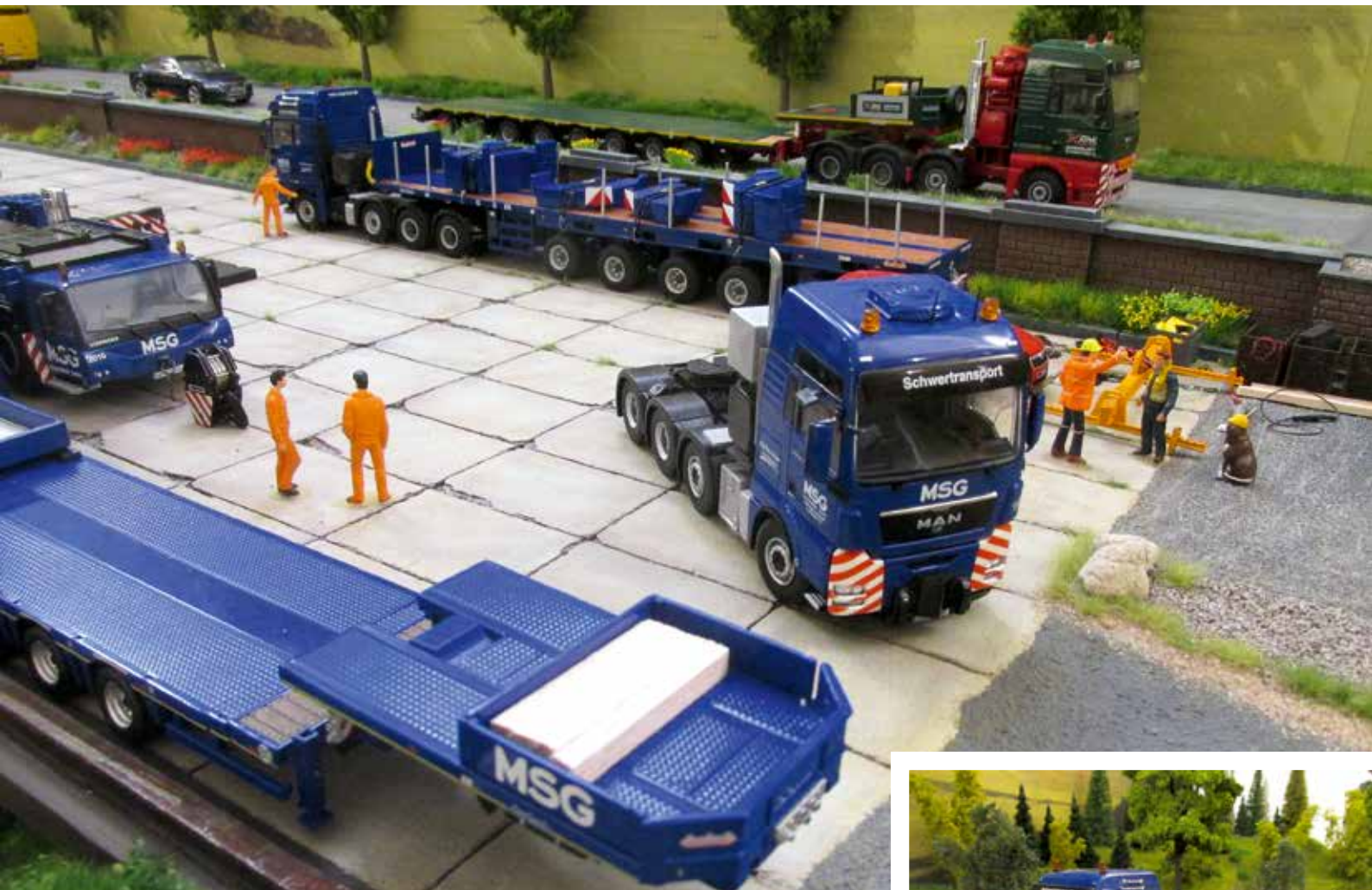
Hier ist viel schweres Gerät im Einsatz.