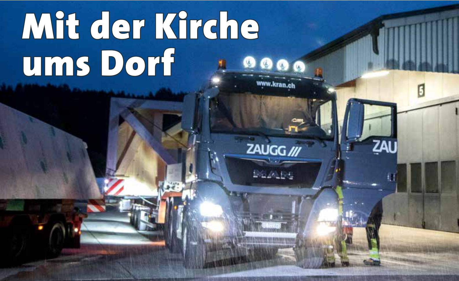
Abfahrbereit bei Regen auf dem Hof von Zaugg. Der vorfabrizierte Kirchturm ist dreigeteilt, sodass als zweites Fahrzeug ein MAN TGS eingesetzt wird.

Am Heiligabend 2019 brannte die Kirche in Herzogenbuchsee. Infolge stürzte das Kirchturmdach auf das Kirchenschiff. Nun war das Ziel bis spätestens am Heiligabend 2020 den Kirchturm mit einer neuen Spitze zu versehen.