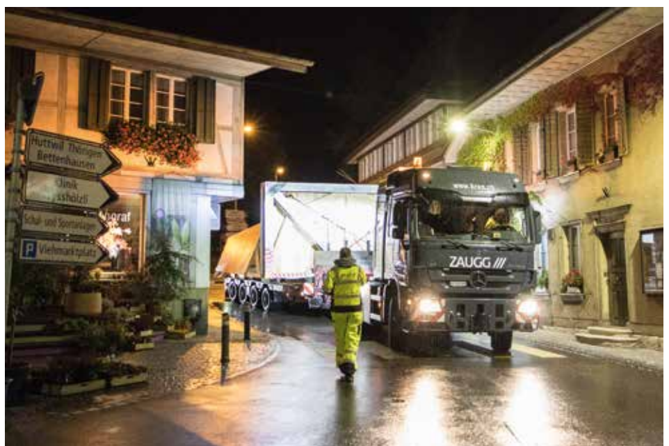
Beengt kommt der Transport zwischen den Häusern hervor.

Nach acht Monaten intensiver Renovation konnte Ende September 2020 die neue Kirchturmspitze auf den Kirchturm gesetzt werden.