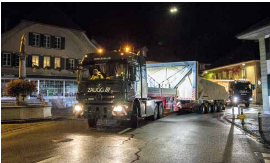
Die beiden Transporte am Dorfbrunnen.

Mit der Kirche ums Dorf gehen ist eigentlich nicht wörtlich gemeint. Mit der Kirche wird eigentlich die Kirchgemeinde assoziiert, welche vor allem in katholisch geprägten Gebieten für ihre Prozessionen bekannt ist. Sprich: lange Fußmärsche ums Dorf oder darüber hinaus. Eingesetzt wird das Sprichwort für lange oder komplizierte Wege. Die Redewendung ist seit dem 18. Jahrhundert geläufig – ein schriftlicher Beleg findet sich 1764, der sich mit der biblischen 40 Jahre währenden Wanderung der Israeliten unter Moses befasst: «wie man sagt 'die Kirche ums Dorf herum tragen'».