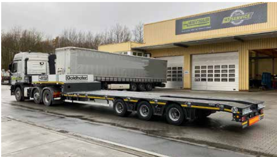
Die HeavyTrailer AG hat sich neben der Fahrzeugvermietung und -verkauf auch sehr stark im Gebrauchtfahrzeuggeschäft positioniert.