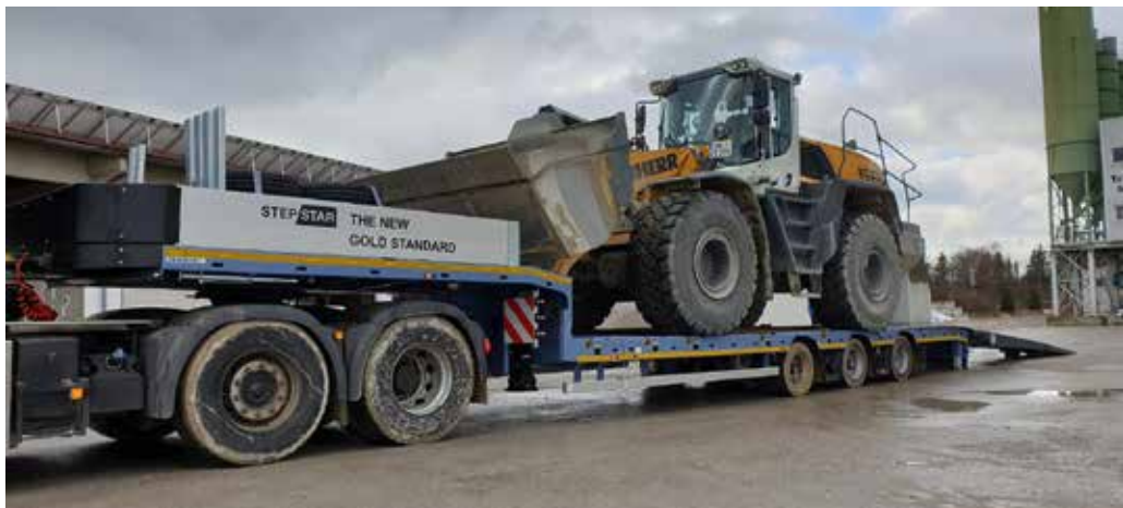
Die neue »STEP-STAR« Baureihe verfügt über ein sehr niedriges Eigengewicht, das sich durch ein dickes Plus in der Nutzlast bemerkbar macht.

Außerdem ist die gesamte Ladefläche mit einem von Goldhofer mitentwickelten verschleißarmen Polymerbelag „TraffideckGO“ versehen. Dieser spart zusätzliches Gewicht und reduziert die Ladehöhe auf 780 mm bei einer 205er beziehungsweise 855 mm bei einer 245er Bereifung. Die neue »STEP-STAR« Baureihe verfügt zudem über eine extra lange und breite Baggerstielmulde mit einer nach hinten offenen Bauweise. Hierdurch können auch größere Baggerstiele problemlos aufgenommen werden.