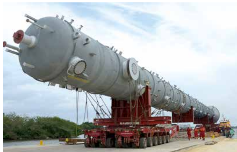
Mammoet war auch für die Verschiffungen, Überlandverkehre und den innerbetrieblichen Transport verantwortlich.