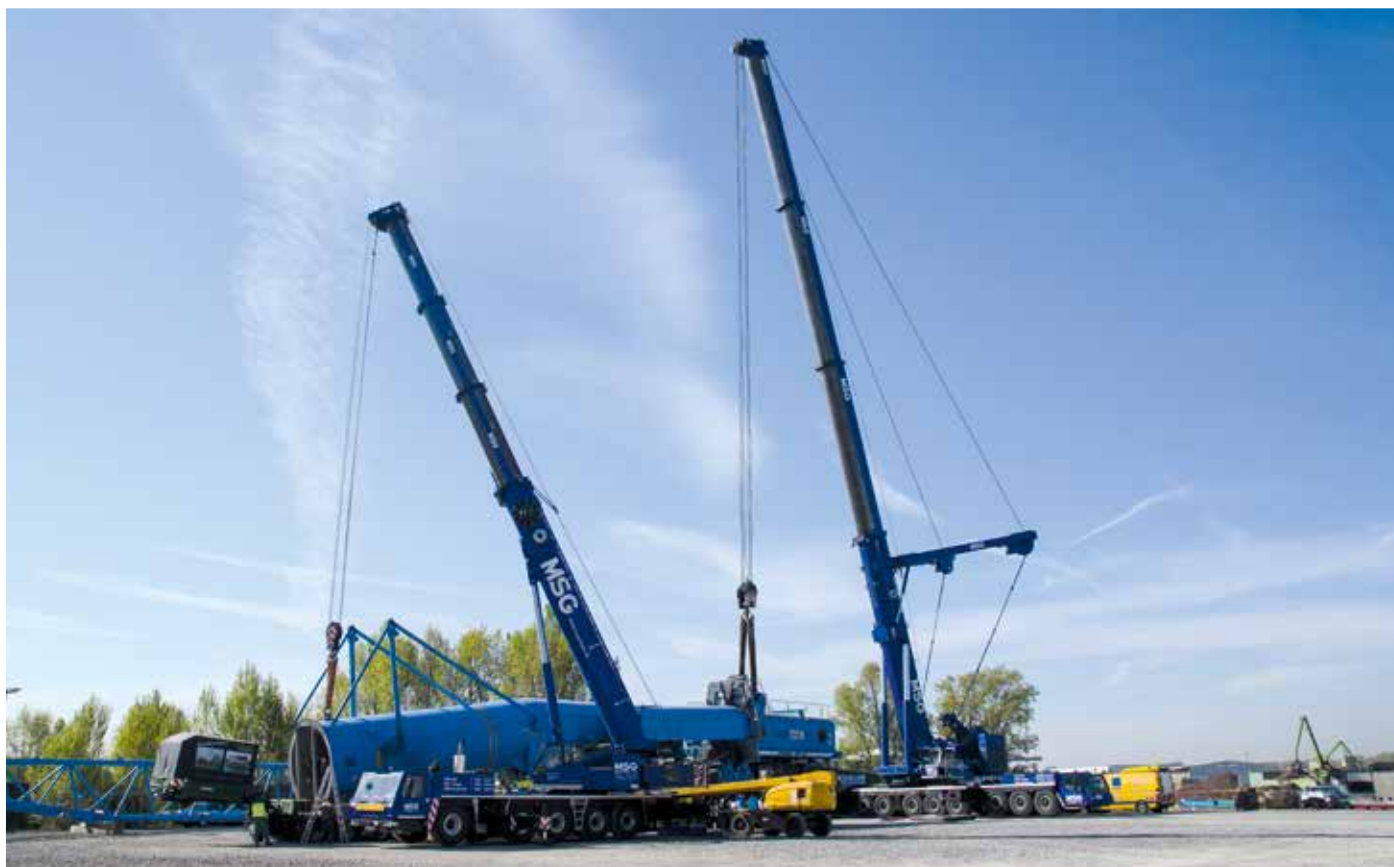
Liebherr LTM 1500-8.1 und Grove GMK 5220 bei der Hafenkranmontage.