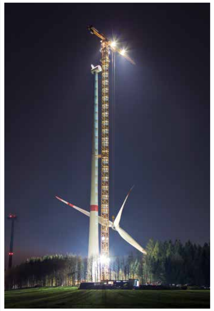
Der Liebherr 1000 EC-B 125 Litronic hebt den kompletten Rotorstern.

Top-Kran mit einer Hakenhöhe von 155,5 m das annähernd 70 t schwere Konstrukt auf eine Höhe von 142,5 m. Der 1000 EC-B 125 Litronic bietet eine maximale Tragkraft von 125 t.