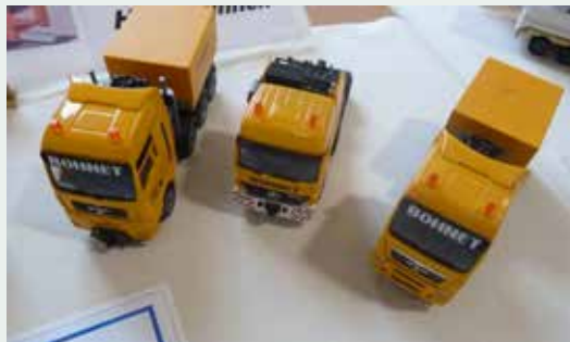
... und solo, geparkt.