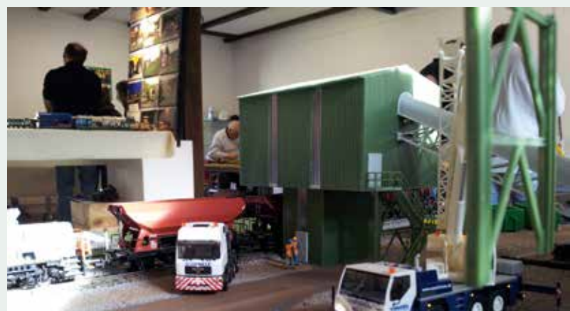
Schönes Diorama mit 3-achsigem Teleskopkran.