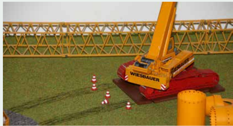
Teleskopraupenkran des Kranbetreibers Wiesbauer.