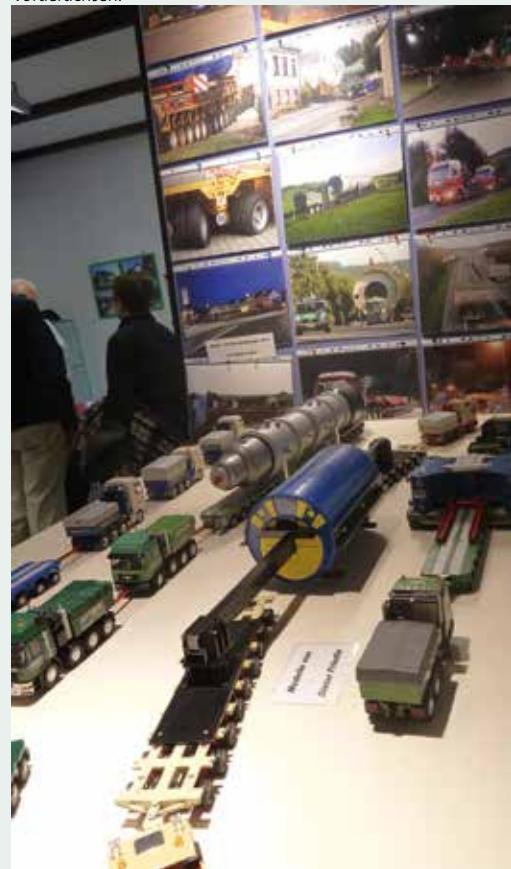
... und noch mehr schwere Brocken.