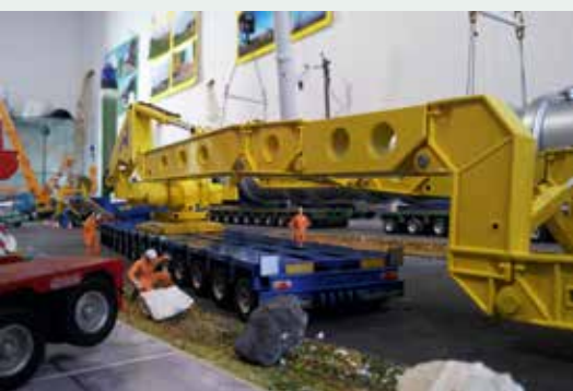
Rüsten einer Transportbrücke.