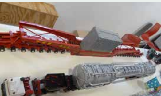
Schwertransporttechnik – beladen ...