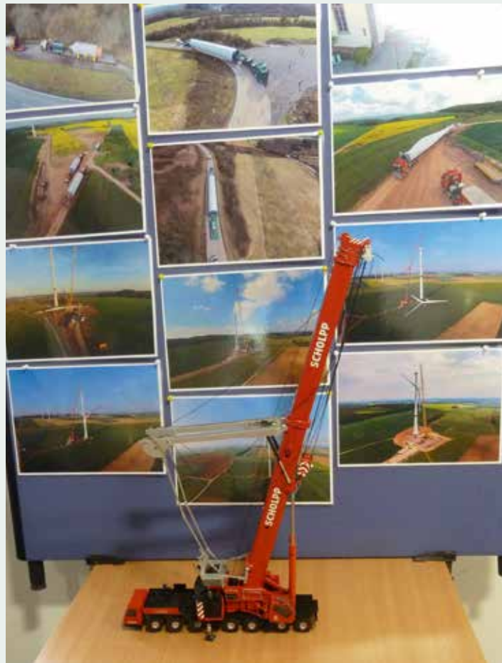
Das Modell – und die Einsatzgebiete des Originals als Fotowand.