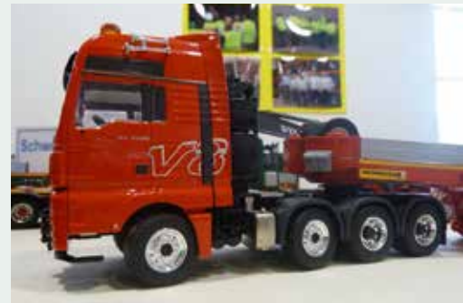
Für V8-Fans ein echtes Schmanagerl.