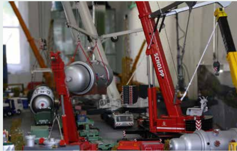
Baumaschinentransport und Umschlagarbeiten – Schwertransporte und Krantechnik waren in Merzig schwerpunktmäßig vertreten.