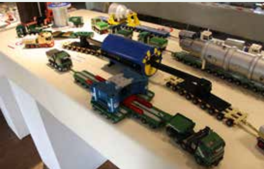
Auch für diese Kübler-Kombination hat es ein Vorbild gegeben.