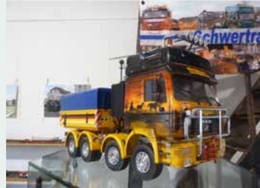
Fett, bunt: 8x4/4-Zugmaschine mit zwei gelenkten Vorderachsen.