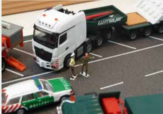
... mit BF3 und Polizeibegleitung.