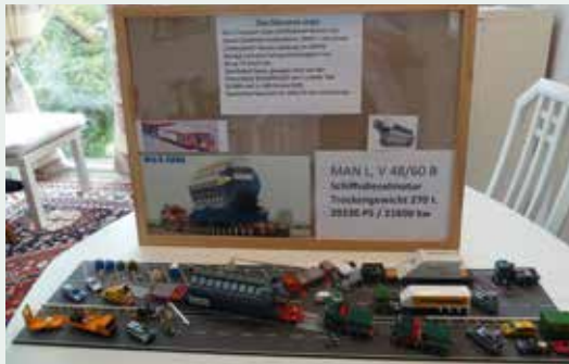
Besonders interessant: Fotografien dokumentieren, auf welchem realen Einsatz das Modell basiert.