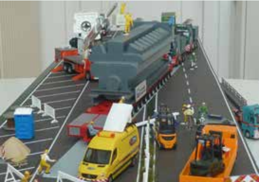
Schwertransport in allen Facetten ...