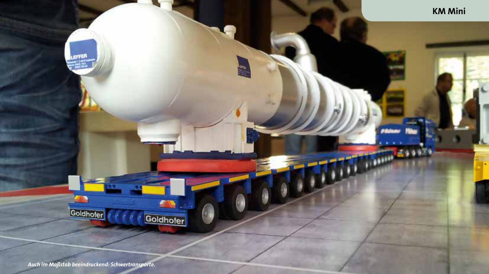
Auch im Maßstab beeindruckend: Schwertransporte.

ne Erlebniswelt besticht durch ihre Detailgenauigkeit, die sich an den Vorbildern orientiert. Zahlreiche Darstellungen realer Ereignisse waren in den Maßstäben 1:87 oder 1:50 ausgestellt und konnten anhand von Fotografien verglichen werden.