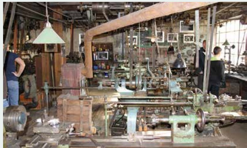
Im Feinmechanischen Museum in der Fellenberg Mühle, Merzig, organisierte die Schwerlastgruppe Saar eine Modellbauausstellung.