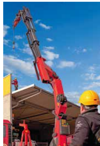
Mit seinem Personensicherungssystem dürfte Palfinger auf der bauma für Aufsehen sorgen.

über ein Gurt-Geschirr verbunden. Die Sicherung der Person erfolgt grundsätzlich am stillgesetzten Kran. Die Personensicherung mit dem Ladekran erfordert neben der technischen Vorbereitung des Krans auch eine genaue Überprüfung der jeweiligen Situation auf der Baustelle und bleibt eine Ausnahme-situation. Zudem müssen genau definierte Sicherungsmaßnahmen erfolgen. Beispielsweise, dass mindestens zwei Personen im Einsatz sein müssen: Eine Person, die gesichert wird, und eine Person, die den Kran bedient. Die Traglastreserven des Krans und die Standsicherheit des Fahrzeuges unterliegen im