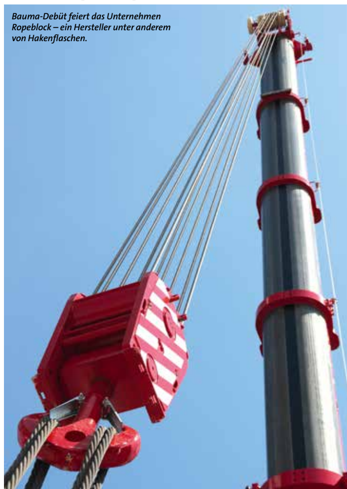
Bauma-Debüt feiert das Unternehmen Ropeblock – ein Hersteller unter anderem von Hakenflaschen.

kurze Lieferzeiten und eine Just-in-time-Lieferung.