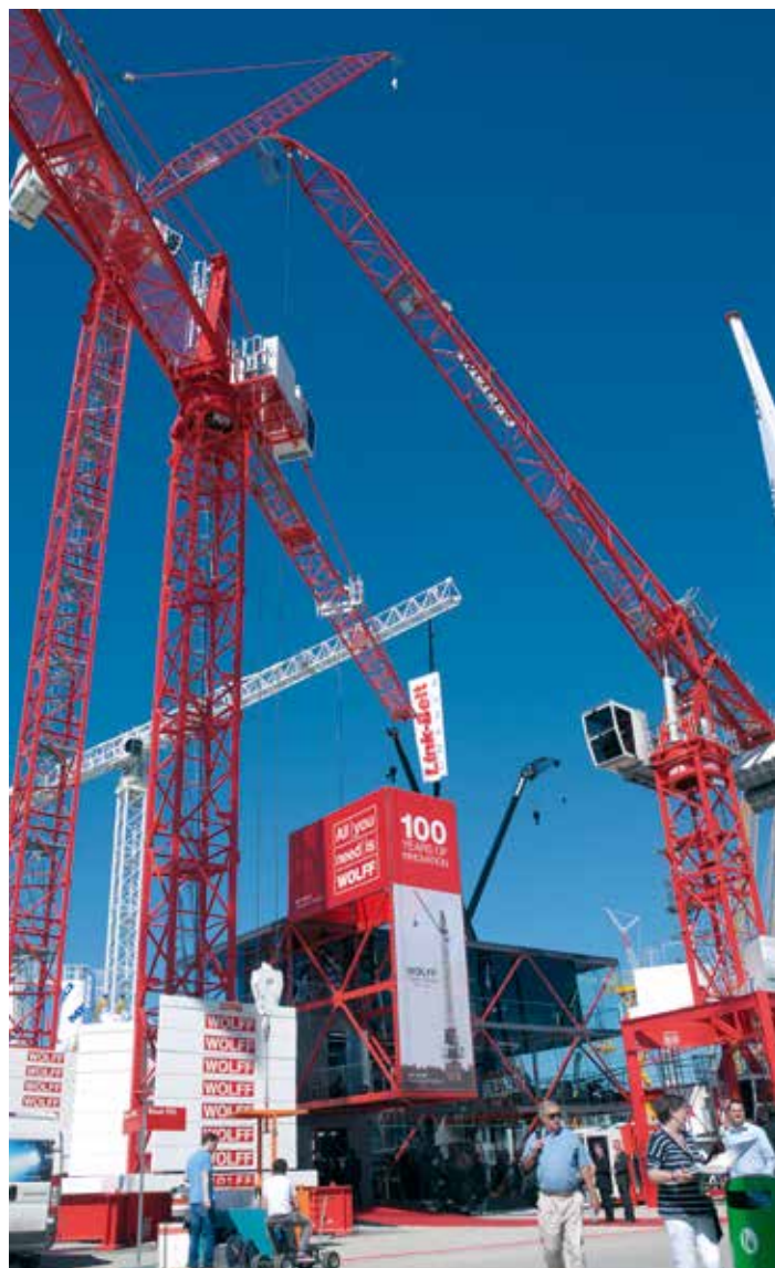
Die Welt zu Gast bei den roten Wölfen in München – hier eine Impression von der bauma 2013.

Riesen überall in den Himmel ragen.“ Wie diese Reise genau aussehen wird? Das ist im April in München zu erleben.