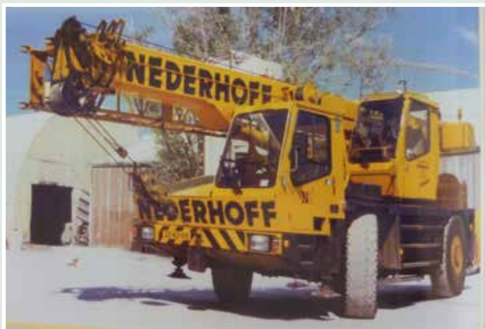
Ein Stück Krangeschichte: Krupp 25 GMT-AT.