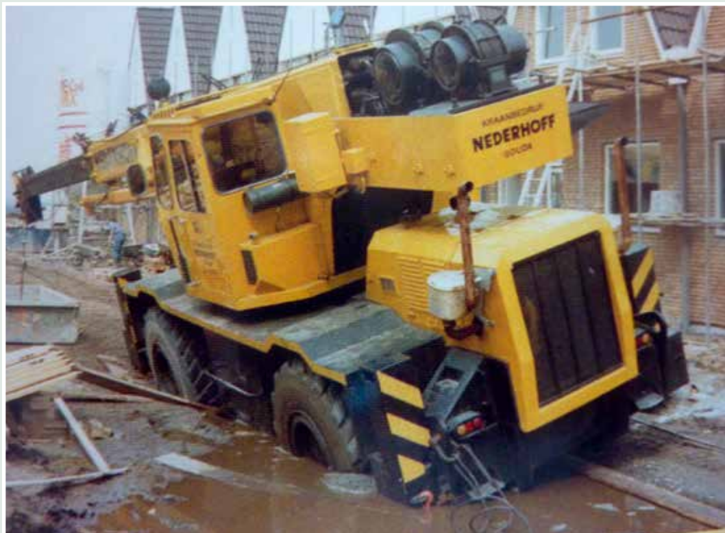
Harter Einsatz für den Rough Terrain-Kran Hyco RT 121.

Um den Wermutstropfen gleich vorwegzunehmen: dieses Buch gibt es derzeit leider nur auf Niederländisch: das 176 Seiten starke Werk von Arie Haaksman, das sich mit Geschichte und Gegenwart des niederländischen Kranbetreibers Nederhoff befasst. Dennoch kommt auch der nicht niederländisch sprechende Nederhoff-Fan auf seine Kosten, dafür sorgen die zahlreichen Abbildungen. Hierbei bietet das Buch viele historische Bilder –