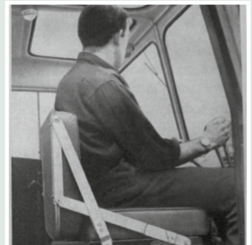
Fahrersitz als „ergonomisches“ Wunder: durch Umklappen wird die Lehne zum Sitz und umgekehrt, so kann auf zwei Seiten gesessen werden.