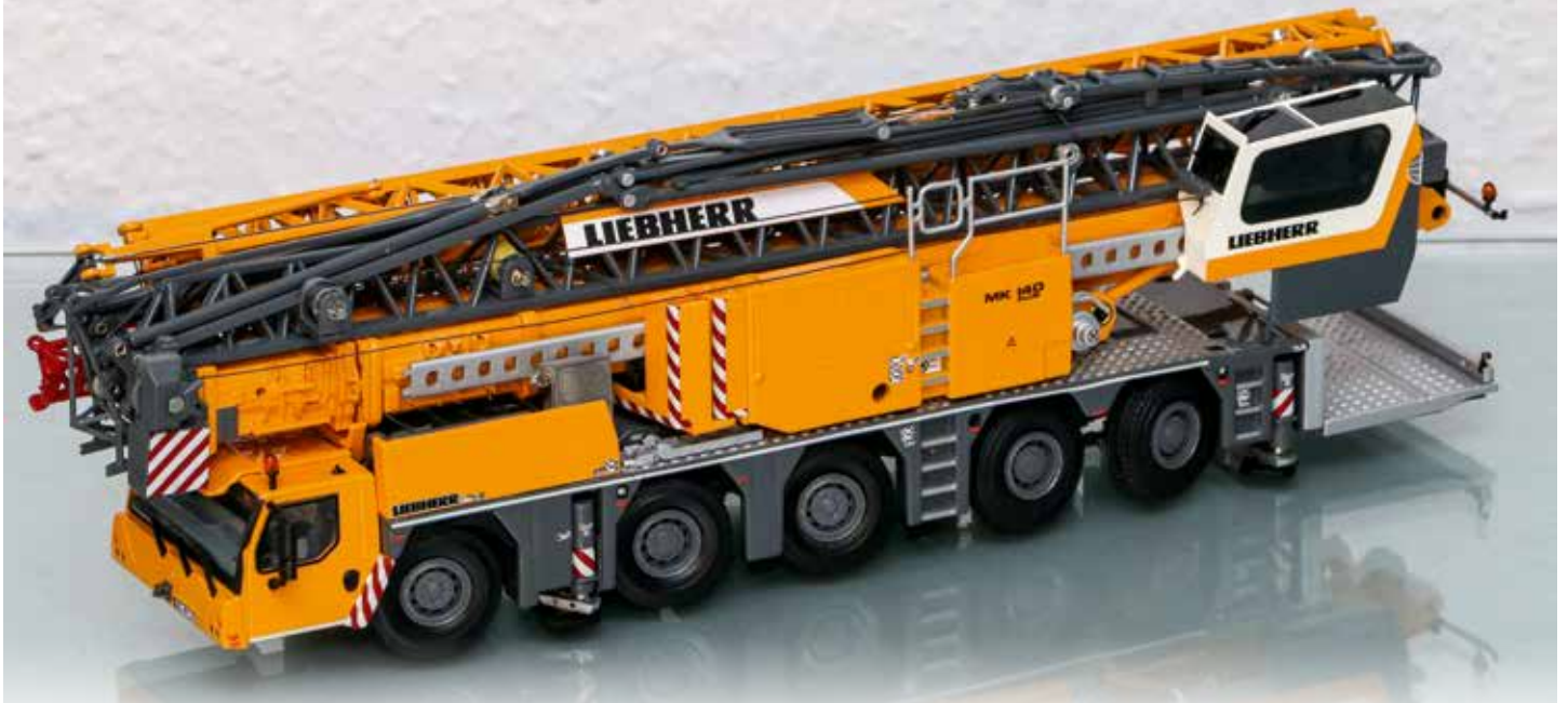
Da kommt er angerauscht: der MK 140 im Maßstab 1:50.

Es gibt Neues von WSI Models. Die Holländer haben sich dieses Mal den größten Kran aus der MK-Palette von Liebherr als Vorbild genommen.