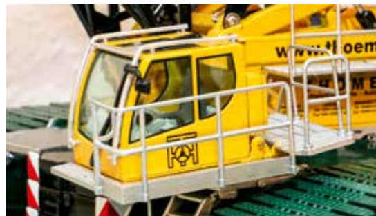
Das Modell besteht durch Detailreichtum und seine Verarbeitung.