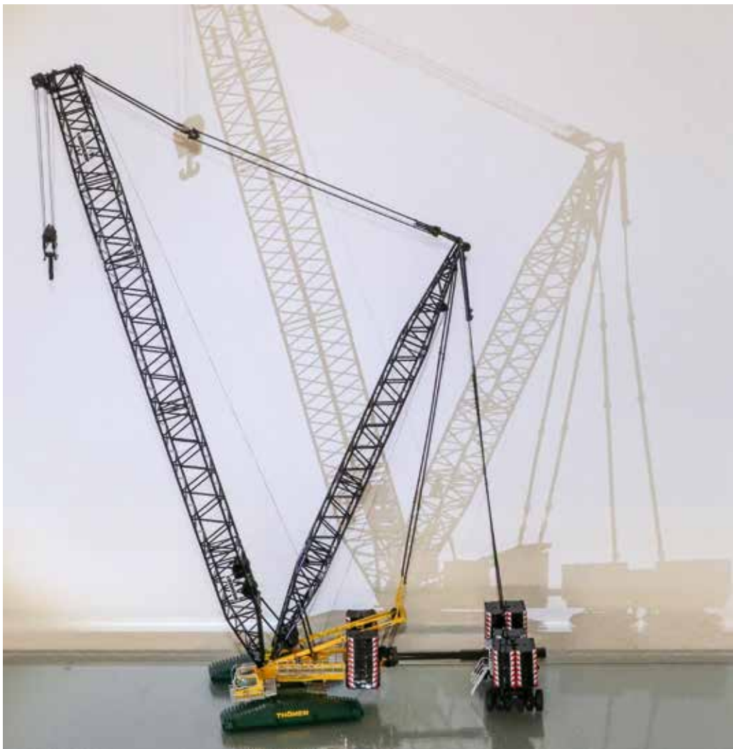
Aufgebaut wurde der 600-Tonner in der Konfiguration HSLDB/BW. Im Lieferumfang ist aber auch die Wippspitze enthalten.