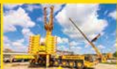
IN AKTION: TANDEMHUB UND EINZELHUB