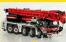
KM MINI: GROVE GMK 4300L-3 IN MAMMOET-FARBEN