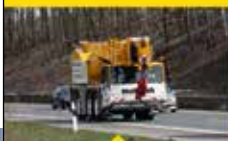
KM SONDERTHEMA: AUTOKRAN- BETRIEBE ALS PRÜGELKNABEN?