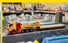
STM MINI: MINI BAUMA 2023 – AUF ZU NEUEN UFERN