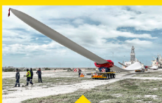
IN AKTION: 6 RBTS FÜR DEN TRANSPORT VON 234 ROTORBLÄTTERN