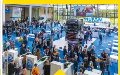
NUFAM 2023: ERFOLGREICHE 8. AUFLAGE