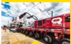
IN AKTION: EIN GANZ BESONDERER EINSATZ!