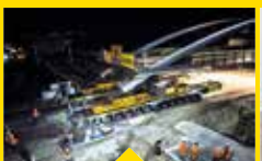
IN AKTION: GIGANTISCHER TRANSPORT ÜBER DIE A 8