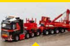
STM-MINI: VOLVO FH 8x4 MEGA WINDMILL TRANSPORTER